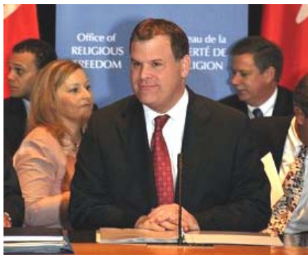
图：加外长约翰·贝尔德就成立“宗教自由办公室”进行了圆桌会议

先生对联邦政府成立宗教自由办公室表示赞赏。李迅说：“在中共持续残酷迫害法轮功和中国人权不断恶化的情况下，加拿大政府坚决支持人权和信仰自由，这对于那些受到中共迫害的人意义重大。我们期待该办公室能对制止中共对信仰的迫害起到进一步推动作用。”