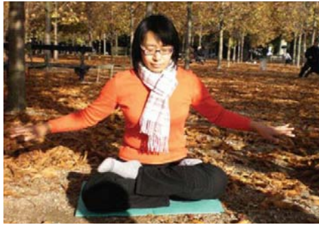
图：作者周末早晨在国家公园炼功

我的病让我对人生极悲观，性格极脆弱。那个时候我就觉得活着没意思。7 岁小学一年级那年，我第一次失学了，是因为白血病，总是住院。