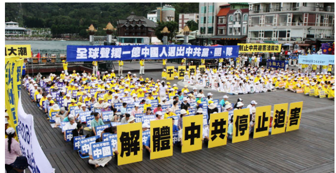
图：十月九日日月潭畔声援一亿中国人“三退”。