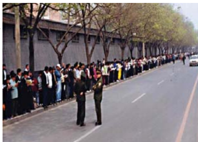
图：1999年4月25日，上万名法轮功学员和平上访，现场秩序井然。

育学院《青少年科技博览》杂志上发表题为“我不赞成青少年炼气功”的文章，捏造事实诽谤法轮功，丑化修炼者形像，天津部份法轮功学员希望通过向天津教育学院或相关机构澄清事实来消除其恶劣影响，天津公安局动用防暴警察殴打，并有四十五名学员被绑架。法轮功学员被天津政府及公安告知：北京公安部介入此事，“你们去北京吧，去北京才能解决问题。”