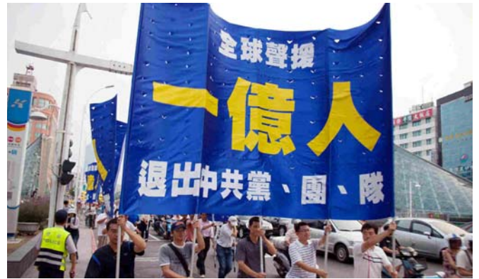
图：十月八日高雄市声援一亿中国人“三退”。

十月九日适逢连休假日，台湾南投县日月潭涌进大量游客，近千名台湾中区各界人士“声援一亿中国人退出中共党团队”集会在码头的广场上举办，浩大的气势吸引了过往游客的注目。服务大陆游客退党的一位志工表示：“现在大陆很多人可以到海外来玩，尤其是他们来台湾以后，在海外退党很踊跃。”◇