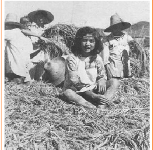
图：在“新华社”和“人民日报”你追我赶的“亩产万斤”谎言竞赛中，让人印象深刻的是这样的照片：照片里的稻子是如此稠密，小孩站在上面或坐在上面，稻子居然压不倒，按照中共媒体的说法，“如同软绵绵的沙发”。