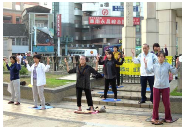
图：清晨，八十一岁的吴老人（中）与法轮功学员正在斗六圆环炼功点集体炼功。

象姓吴的老人这样祛病神速的例子，在法轮功学员中相当普遍。那种康复后获得的幸福与喜悦也只有当事人才能体会得到啊。在修炼法轮功的群体中，有相当大数量的人，就是在人生路已尽时，知遇了法轮功而成为最幸福的人。◇