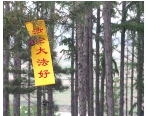
大陆法轮功学员悬挂的“法轮大法好”真相条幅

这位警察看过好多法轮功真相资料，明白了修炼法轮功在中国完全是合法的，而迫害法轮功才是违法的，另外迫害善良要遭现世现报的。他以前在无知中也参与过抄家、蹲坑之类的，这次放了那位法轮功学员是在将功补过。他说以后还要尽最大努力保护法轮功学员。