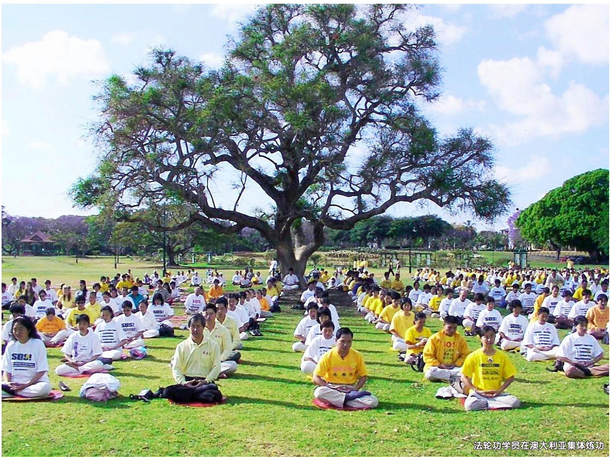
法轮功学员在澳大利亚集体炼功

在地处南半球的澳大利亚和新西兰，法轮功受到了广泛的褒奖和支持，炼功点遍布各大城市。