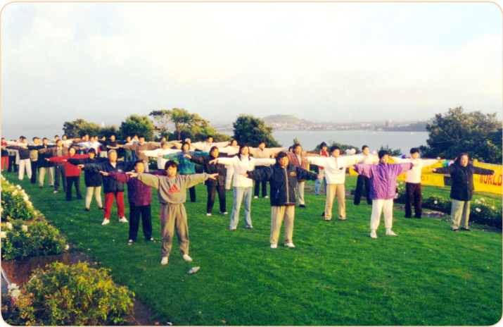
新西兰法轮功学员集体炼功