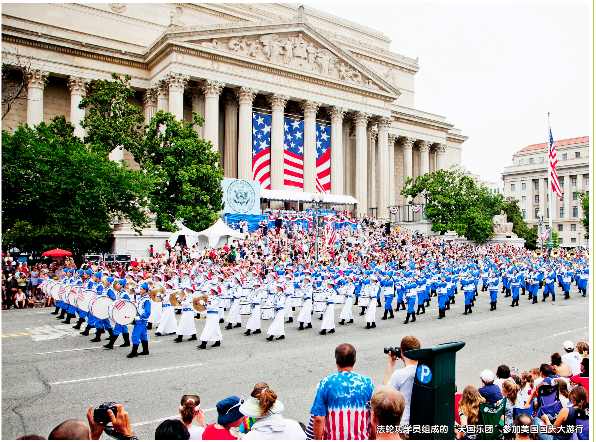
法轮功学员组成的“天国乐团”参加美国国庆大游行