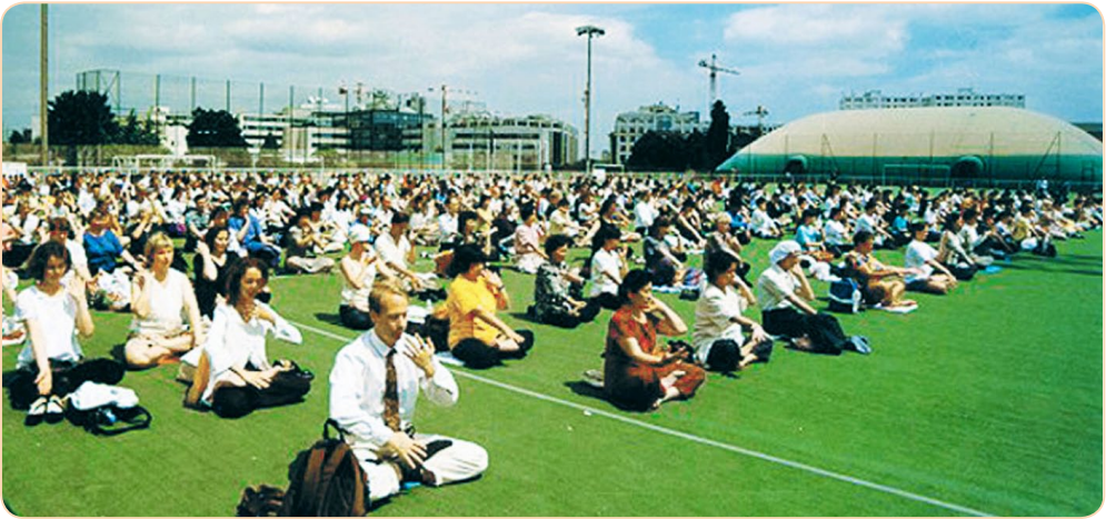
法轮功学员在法国巴黎集体炼功

早在 20 年前，控制东欧九国的共产主义暴政，就被欧洲人民埋葬了。如今中共残害法轮功学员的种种暴行，也遭到欧洲社会的一致谴责。十多年来，通过决议、报告和议会质询等形式，欧盟一直关注法轮功学员遭受酷刑迫害的案例，特别对于被监禁的法轮功学员的器官被活摘并贩卖给医院的消息感到担心。欧盟多次施压要求中共政府停止迫害。