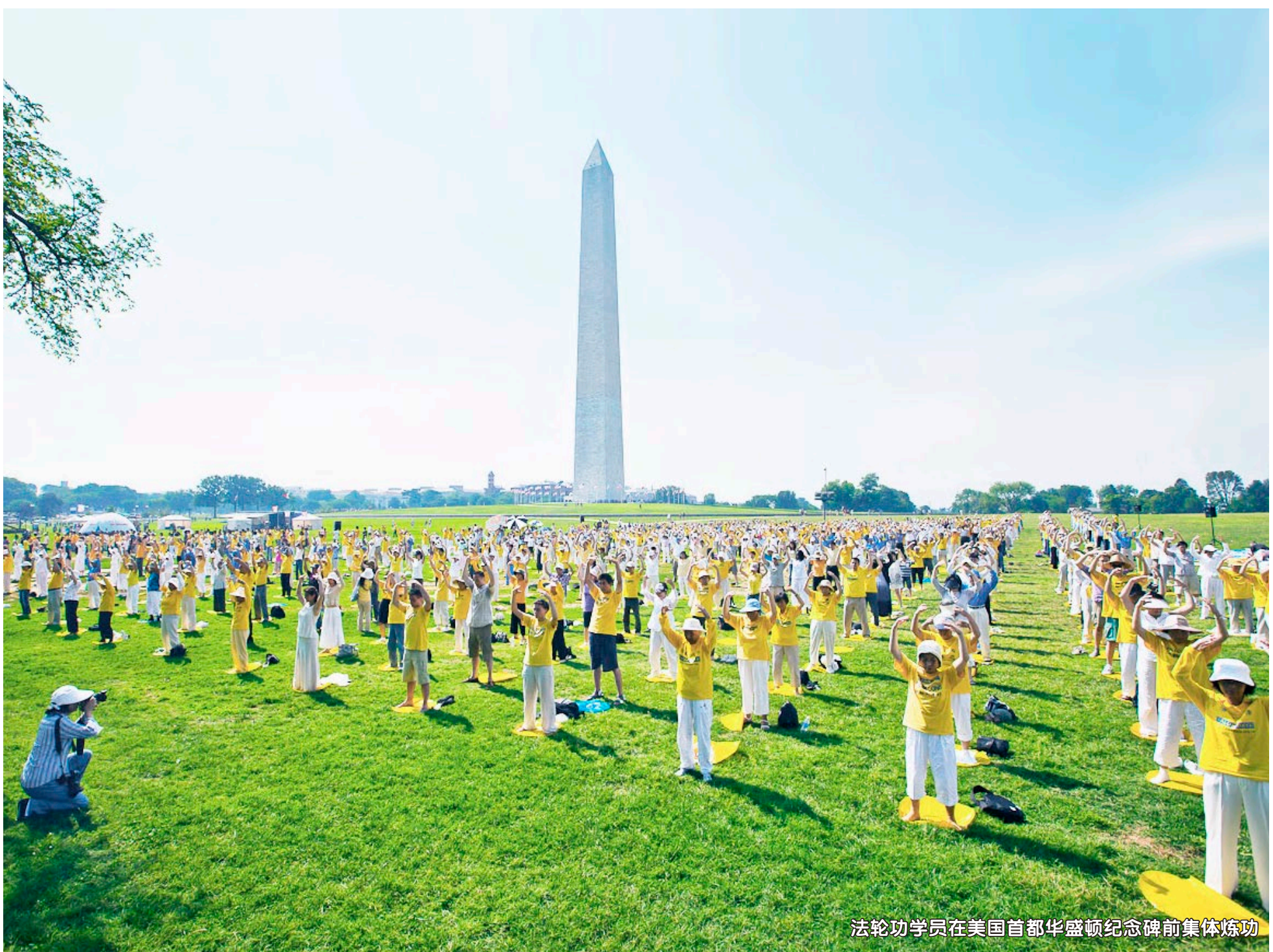
法轮功学员在美国首都华盛顿纪念碑前集体炼功

美国 50 个州中，47 个州有法轮功炼功点，修炼者很多是科学家、工程师、教授和研究生。每年 7 月都有数千法轮功学员汇集首都华盛顿，向世界呼吁“制止中共对法轮功学员的残酷迫害”。法轮功学员赢得了美国各界人士的尊敬与支持，美国国会已通过多项决议谴责中共，要求中共立即停止迫害，释放所有被关押的法轮功学员。