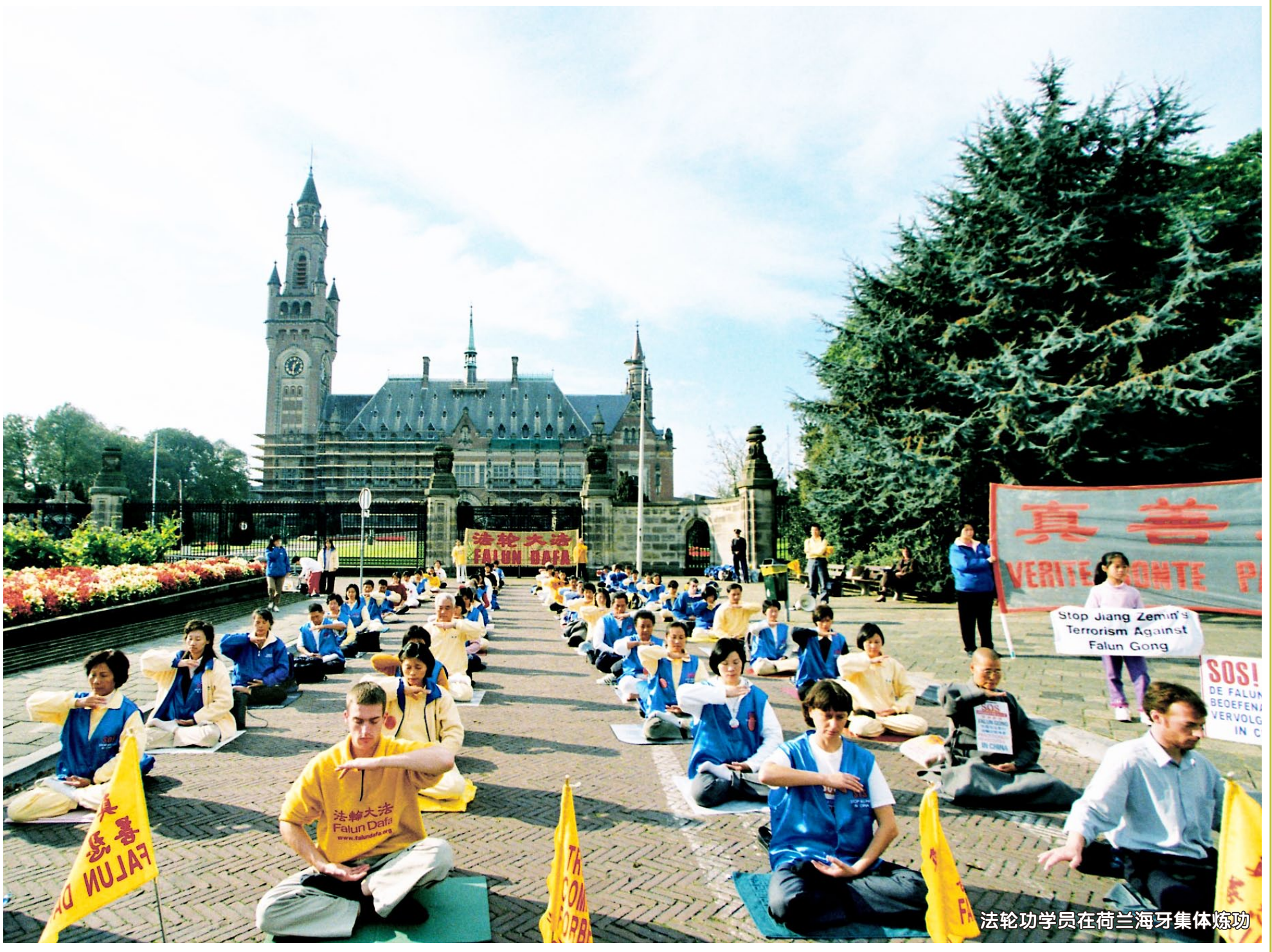
法轮功学员在荷兰海牙集体炼功