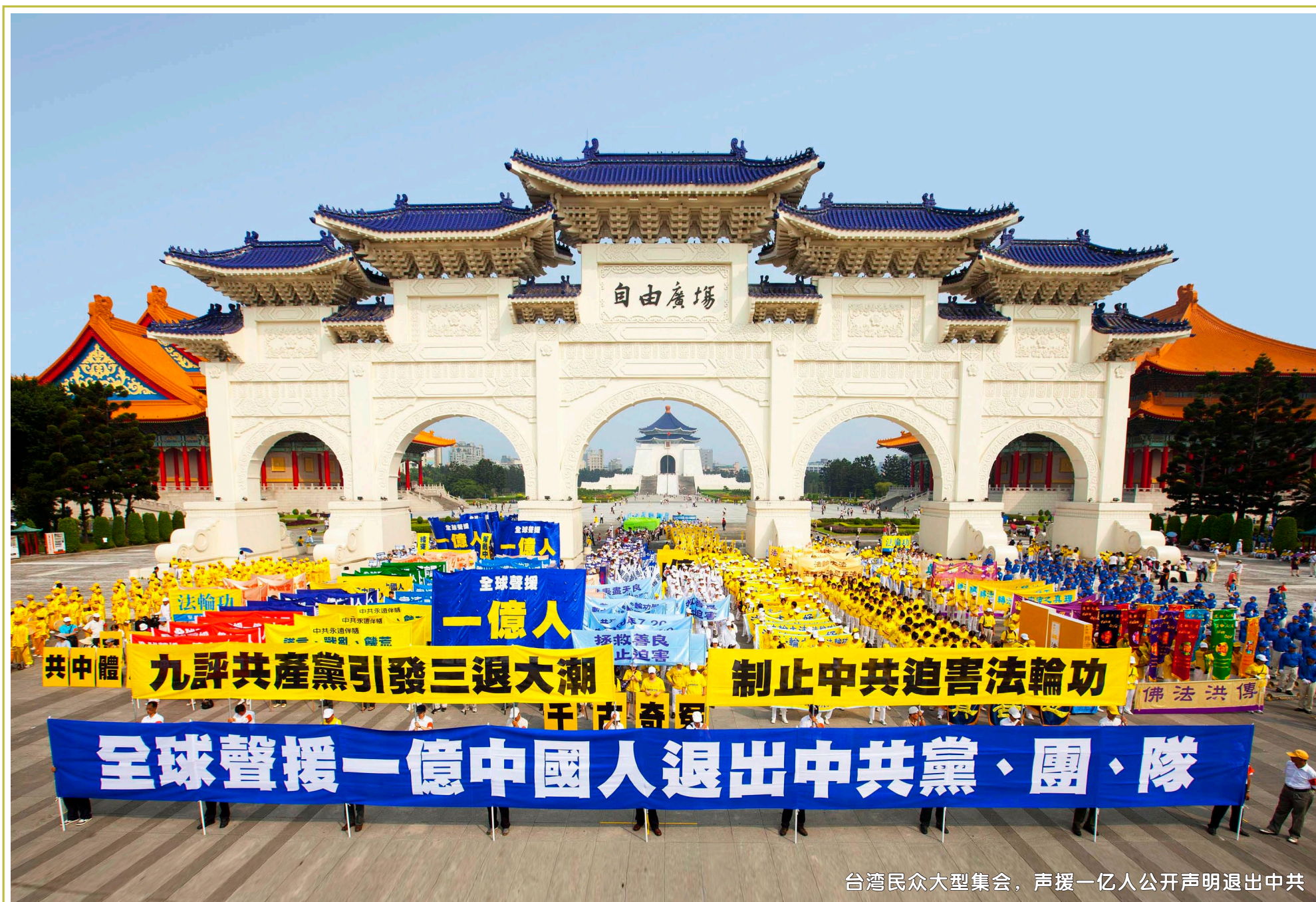
台灣民眾大型集會，聲援一億人公開聲明退出中共