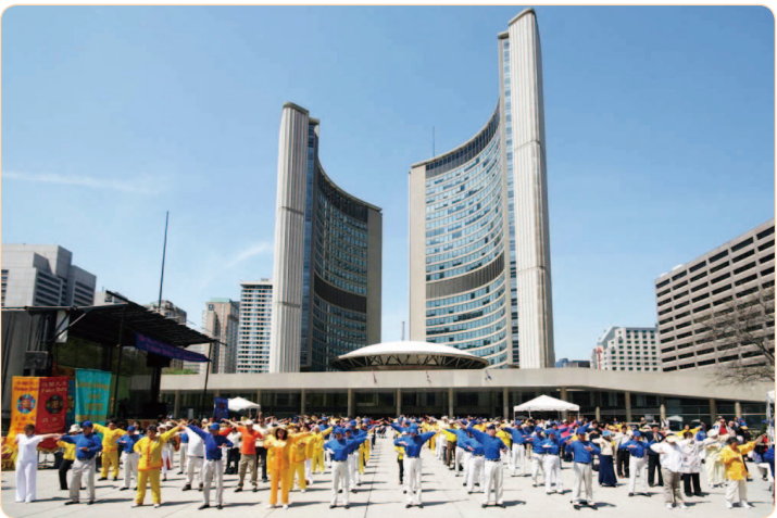
加拿大法轮功学员集体炼功

法轮功在加拿大深入人心。2011 年 5 月，总理哈珀连续第 6 年给“法轮大法月”发来贺信，赞扬法轮大法长期以来与加拿大社会分享“真善忍”理念。加拿大多位联邦部长、省市政要也纷纷称赞法轮功学员的坚忍宽容，称赞“真善忍”理念启迪世人，造福社会。