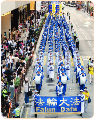
香港法轮功学员游行

在澳门，十余年来，法轮大法的真相越来越深入人心。明白真相的社会各阶层人士，在陆续地走入法轮大法的修炼。