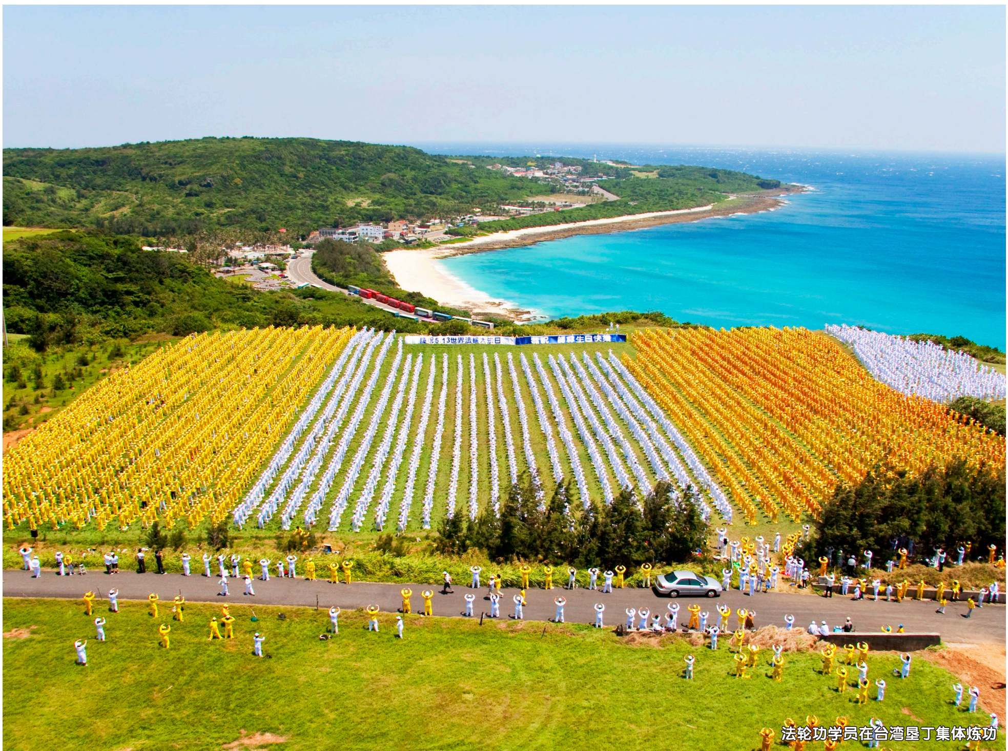
法轮功学员在台湾垦丁集体炼功