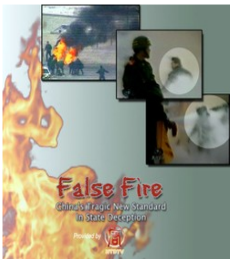
由北美非营利民间中文电视台“新唐人”制作的分析二零零一年天安门自焚事件的影片《伪火》（False Fire）获第五十一届哥伦布国际电影电视节荣誉奖。