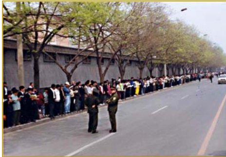
秩序井然的“四二五”上访民众

然而江泽民集团为迫害法轮功，蓄意把“四二五”和平理性的依法上访歪曲成“围攻中南海”，在国内外大肆诬陷宣传，混淆视听迷惑民众。但是由于共产党的专政历来被国际