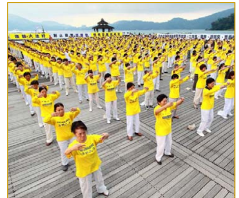
为制止迫害 台湾法轮功学员在日月潭畔集体炼功、讲真相

这样的例子在台湾数不胜数，在世界各地都屡见不鲜，由此可见，中共野蛮的迫害和诽谤，根本无法阻挡法轮功在全世界的弘扬，迄今十二年来，法轮功传遍世界一百多个国家和地区，受到不同族裔各阶层民众的喜爱，法轮功的主要著作《转法轮》被译成三十多种文字在全世界发行。中共的残酷迫害并没有打倒法轮功学员，法轮功更在反迫害中屹立不摇，并蓬勃发展。◇