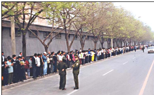
1999年4月25日，万名法轮功学员上访，秩序井然。

【明慧网】一九九九年四月二十五日，上万名法轮功学员自发到中南海附近的国务院信访办公室上访，整个过程和平理性，秩序井然。这本是一次公民行使宪法赋予的上访权利的合法行为，被称作“中国上访史上规模最大、最理性平和、最圆满的上访”，却被中共江泽民集团歪曲用来迫害法轮功，它的诬陷宣传无法阻挡更多海外民众因为“四二五”和平上访而认识法轮功并走入修炼。