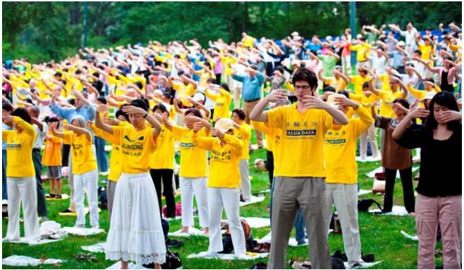
8月27日清晨，纽约市曼哈顿中央公园的草坪上，各年龄各族裔的数百人随着音乐，整齐地展示着法轮功五套功法。