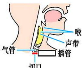
气管切开插管示意图

还对着麦克风唱歌！烧伤患者最怕细菌感染，央视记者却不穿隔离衣、不戴口罩帽子，用沾满细菌的话筒近距离采访。