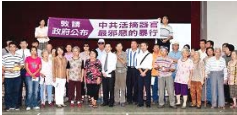
“台湾人赴中国大陆移植器官面面观”讲座结束后，大家呼吁共同制止中共暴行