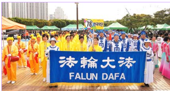
韩国富川庆典 法轮功团体获嘉奖