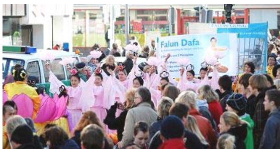
德国大游行 法轮功团体获嘉奖

十二年来，法轮功在中国大陆受到全方位的迫害，而在世界 100 多个国家和地区却弘扬光大，这到底是为什么？