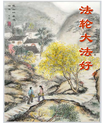
水墨画《远山故里送福来》

中共不等于中国，中共的党文化更不是中国文化。与中国人民和中国文化为敌的中共才是真正的反华势力。此次在林肯中心的零上座率是中共党文化宣传覆败的一个例子。（文／云帆）