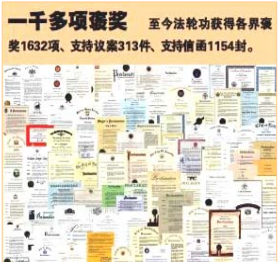
图：李洪志先生和法轮大法因对人类身心健康做出的杰出贡献，获得各国政府各类褒奖、支持决议案和信函超过 3000 项。

法轮功要求修炼人按照宇宙“真、善、忍”特性去自我完善，提高道德与境界。纯粹从做人这方面说，与传统儒家文化中的“修身、齐家、治国、平天下”的“修身”有相通之处，当然法轮功还教人达到更高的境界，从这个角度上讲，传统文化起到了铺垫的作用。可是就是因为法轮功讲的是“真、善、忍”，与中共“假、恶、斗”并要求为其献身的邪恶教义不一样，加上中共党魁的妒嫉与权力欲望，于是便有了对法轮功的血腥迫害。法轮功如何也不是中共说了算的。而