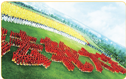
湖北武汉法轮功学员集体炼功排列出“法轮大法”四个大字

由此，我主动了解法轮功，找《转法轮》看，真正明白了法轮功真相。现在我从心里认定了“法轮大法好、真善忍好”，还主动退出了中共团队组织。