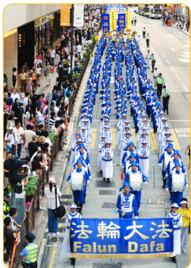
香港法轮功学员游行受欢迎

那时，他正在经营浴具店，一位《大纪元》（一家跨国华人报纸）的广告销售员找他做广告，他十分犹豫，因为《大纪元》一直受中共攻击，而他的产品有些是从中国进口的。销售员叫他试试，说不会影响他回国的。于是，他答应先做四周，其间他回国没有受任何影响，这样，他就签了一年的合约。在这期间，他还为当地“法轮大法日”的活动和“营救中国大陆被迫害致死法轮功学员遗孤”的演出，赞助了几百元钱。虽然只是区区的几百元钱，看似很平常，但是支持法轮功的善念，尤其是在法轮功受到中共的残酷迫害时，敢于选择并表达自己对法轮功的支持，让他获得了巨大的福报。