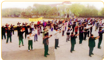
1999年之前，部分清华大学法轮功学员在清华学堂前集体炼功

还有一位因患白血病而休学的硕士研究生，修炼法轮功短短两个月，脸色变得红润，头上长出又黑又密的头发；三个月后到医院检查，指标恢复正常了；半年后，他回到课堂，最终获得硕士学位。在活生生的事实面前，他的父母也走入了法轮功修炼。