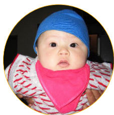
福娃六个月时的照片

喜气洋洋的茶庄老板一家人，忽然愁眉不展，满脸悲情。原来他家怀孕八个多月的侄媳妇，被川医附二院确诊为胎儿双肾积水，医生建议中止妊娠。侄媳妇虽舍不下亲生骨肉，但是没有别的办法。