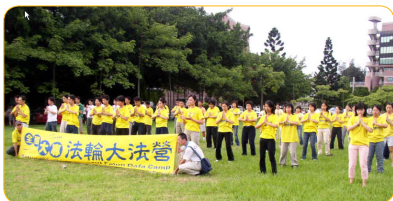
台湾清华大学校园内的集体炼功

大家都感到非常震惊，问我吃了什么灵丹妙药。其实，我只是把“法轮大法好、真善忍好”种在了心里，这九个字给了我一个善果。