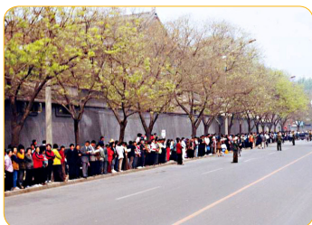
“四·二五”上访现场，秩序井然

出于对政府的信任，法轮功学员4月25日自发来到国务院信访局（中南海旁边）和平上访，上访群众由警察引领在中南海对面沿街站着。当日，在国务院总理的关注下，合理解决了天津暴力抓人事件，学员们平静地散去。