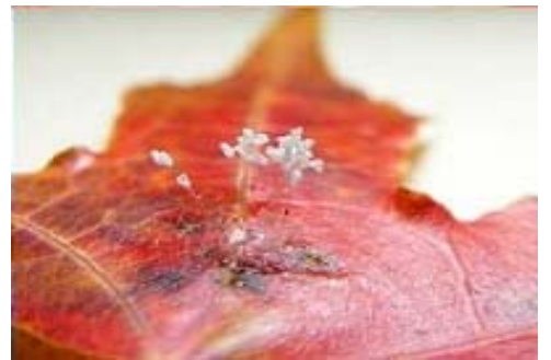
枫叶上盛开的优昙婆罗花

朋友，您知道吗？如何保命，如何跨入人类的新纪元？如果您还不明白，请来看看这世间的希罕之物——优昙婆罗花，优昙婆罗花的盛开意味着什么？