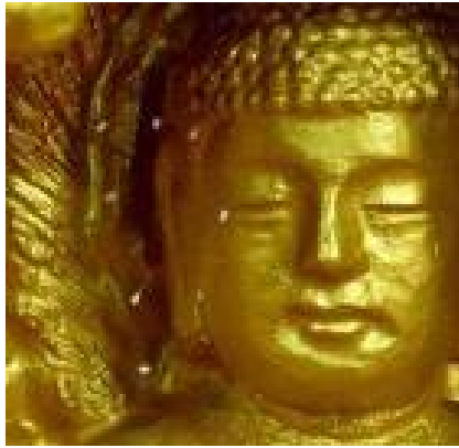
韩国佛像上的优昙婆罗花

一九九九年七月二十日，这一切的美好都被中共血腥的镇压搅乱了，我为我们的国家和人们哭泣！怎么能够诬陷、造谣、打压天底下最善良的人群？法轮大法实在是太