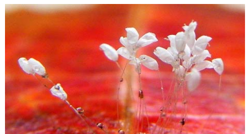
上图中扩大的优昙婆罗花