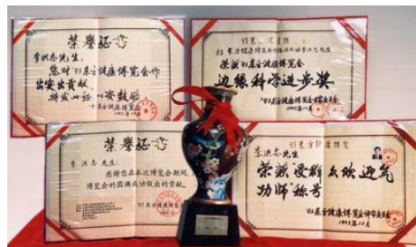
图：九三年东方健康博览会最高奖

法轮大法自一九九二年五月公开传出，强调用“真善忍”的法理要求自己，不断提高道德标准；五套功法简单易学，祛病健身功效卓著。法轮功使全世界上亿的修炼者获得了身心健康，找到了人生的意义。九三年北京东方健康博览会上，法轮功创始人李洪志大师荣获博览会最高奖“边缘科学进步奖”和大会的“特别金奖”，及“受群众欢迎气功师”称号。九九年七月中共江氏集团出于嫉妒，残酷迫害法轮功学员。十二年来法轮功学员坚持