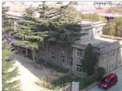
山东招远岭南金矿洗脑班

专家鉴定,其结论为天然形成。而石头上清晰可见的六个字是:“中国共产党亡”。原来“天灭中共”这个说法的来源,却发现居然是上天点拨石头“实话实说”。