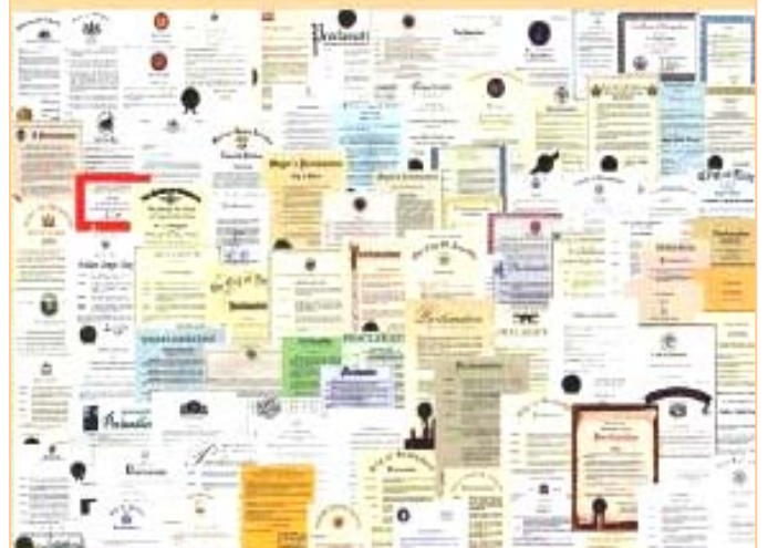
图：李洪志先生和法轮大法因对人类身心健康做出的杰出贡献，获得各国政府各类褒奖、支持决议案和信函超过 3000 项。

一千多项褒奖 至今法轮功获得各界褒奖1632项、支持议案313件、支持信函1154封。