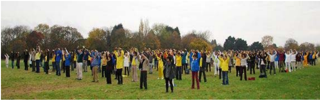
欧洲各国法轮功学员在伦敦摄政公园 (Regent's Park) 集体炼功

【明慧网】儒家文化对中国社会的影响持久而深远。然而到了近代，儒家文化遭受了中共前所未有的破坏。这不仅体现在文革后期对孔子的批判上，中共在建政之初就已经开始对包括儒家在内的传统文化实施彻底而全面的破坏了。为什么？道理很简单，儒家的中庸思想与仁义礼智信的教导和中共的