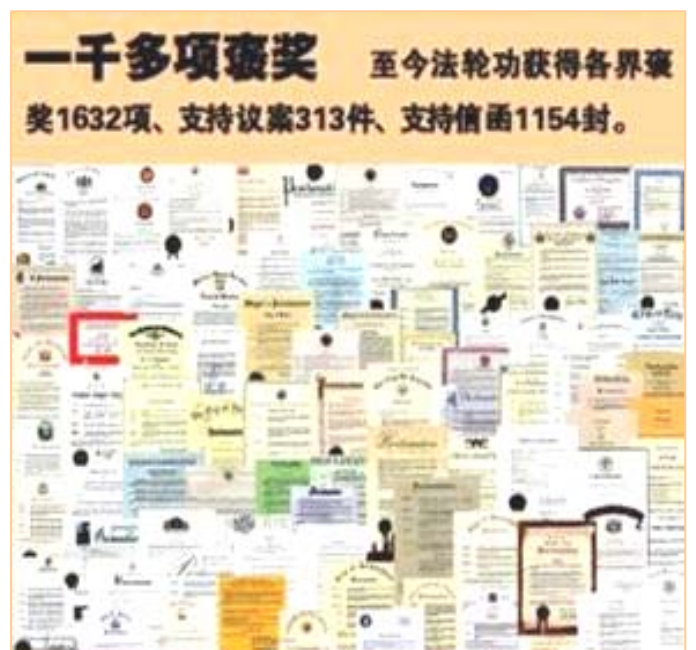
图：李洪志先生和法轮大法因对人类身心健康做出的杰出贡献，获得各国政府各类褒奖、支持决议案和信函超过 3000 项。

上述两个事例，一个是从政府部长层面上对法轮功进行颂扬，一个是以修炼法轮功的外国人的成绩及感言，来表达法轮功的美好。这真令人感慨：为何传自于我们中国的法轮功，在自己的国家受到迫害，而在世界上却受到褒奖？其实这个问题也很好回答，那就是从中共的邪恶本质上找答案。这样一个以斗争哲学为基础，以阶级斗争为其理论及实践的独裁暴政，怎么能容得了正统的优秀文化？因为优秀的文化讲的都是个人的完善，以及人与人之间的友善，而中共却是将善良的人性用它的阶级性和党性来替代。共产主义是我们这个世界的毒瘤，中共则是这个毒瘤中最邪恶的内核。