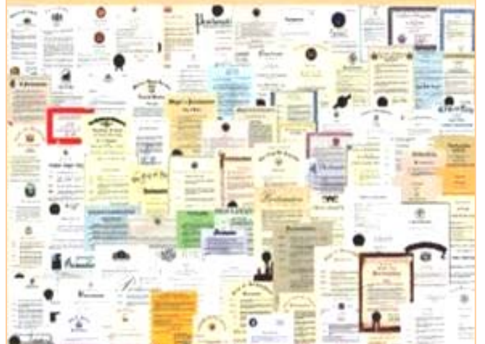
图：李洪志先生和法轮大法因对人类身心健康做出的杰出贡献，获得各国政府各类褒奖、支持决议案和信函超过 3000 项。

一千多项褒奖 至今法轮功获得各界褒奖1632项、支持议案313件、支持信函1154封。