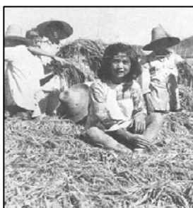
上图：在中共“大跃进”运动中，“亩产万斤”的假新闻充斥官方媒体。为了说明谎言的“真实”，喉舌媒体刊登女孩坐在浓密禾苗上的照片。