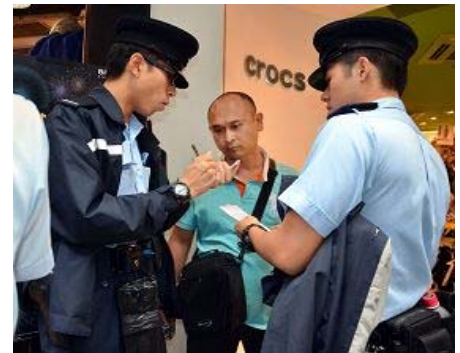
该真相点十三日两次遭到凶徒袭击。 第二宗袭击的凶徒（中）遭警方拘捕

他促请港府当局正视这些事件，彻底追查真相，把罪犯绳之以法，绝不能姑息纵容；并要求保护法轮功学员合法的和平申诉活动，预防及制止恶势力对他们的攻击、干扰及破坏。