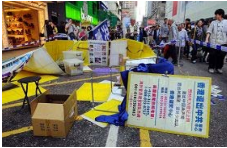
旺角西洋菜街的法轮功真相点 十三日下午遭凶徒恶意破坏

香港法轮功学员在旺角街头设置的真相点及退党服务点，二零一一年十一月十三日接连两次遭到暴徒蓄意破坏，警察已将凶徒拘捕。法轮功学员强烈谴责中共雇凶逞恶，敦促港府查明真相，将罪犯绳之以法。许多议员和民众也纷纷谴责中共输出暴力，严重损害香港的核心价值。