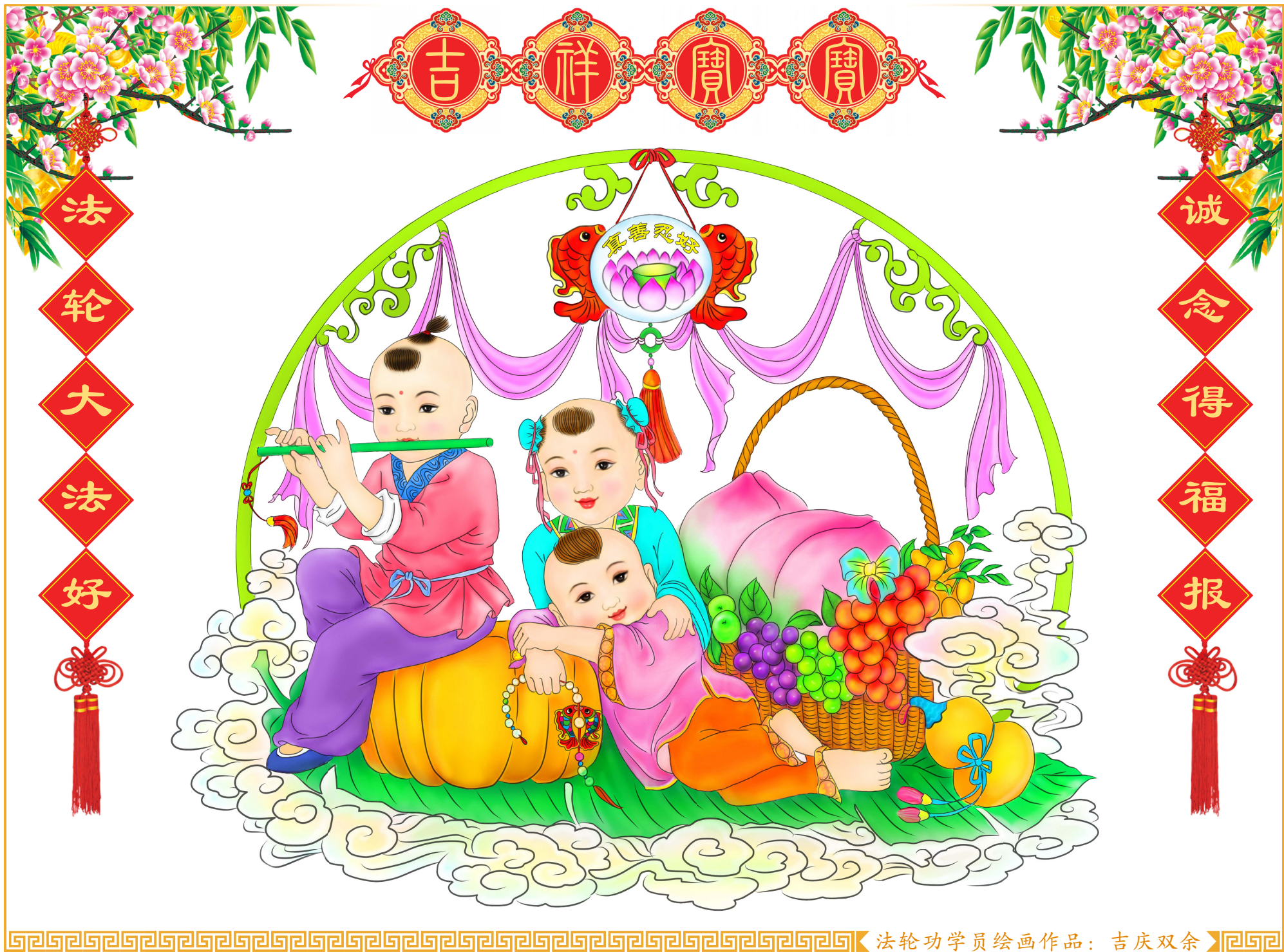
法轮功学员绘画作品：吉庆双余