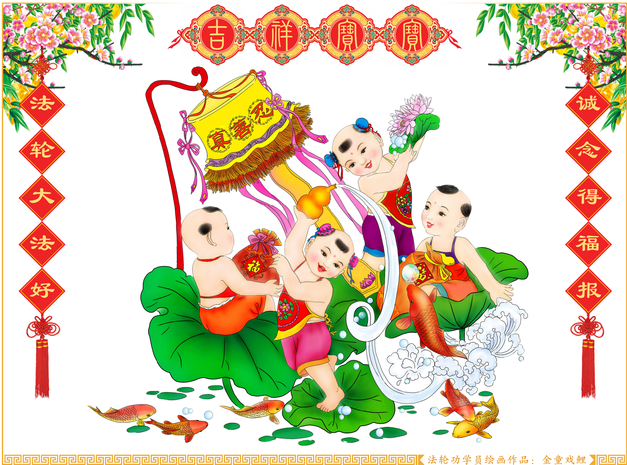
法轮功学员绘画作品：金童戏鲤