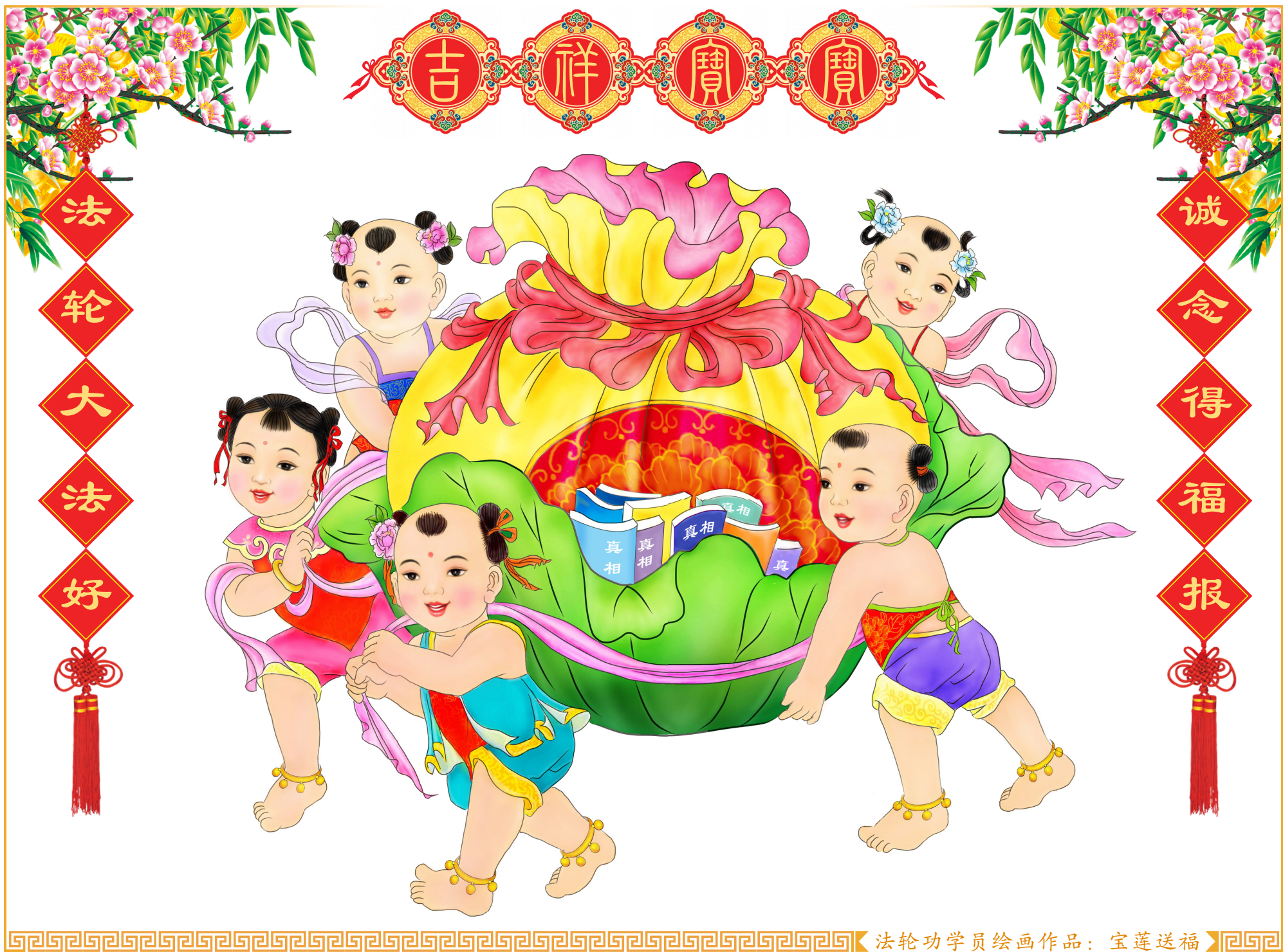
法轮功学员绘画作品：宝莲送福