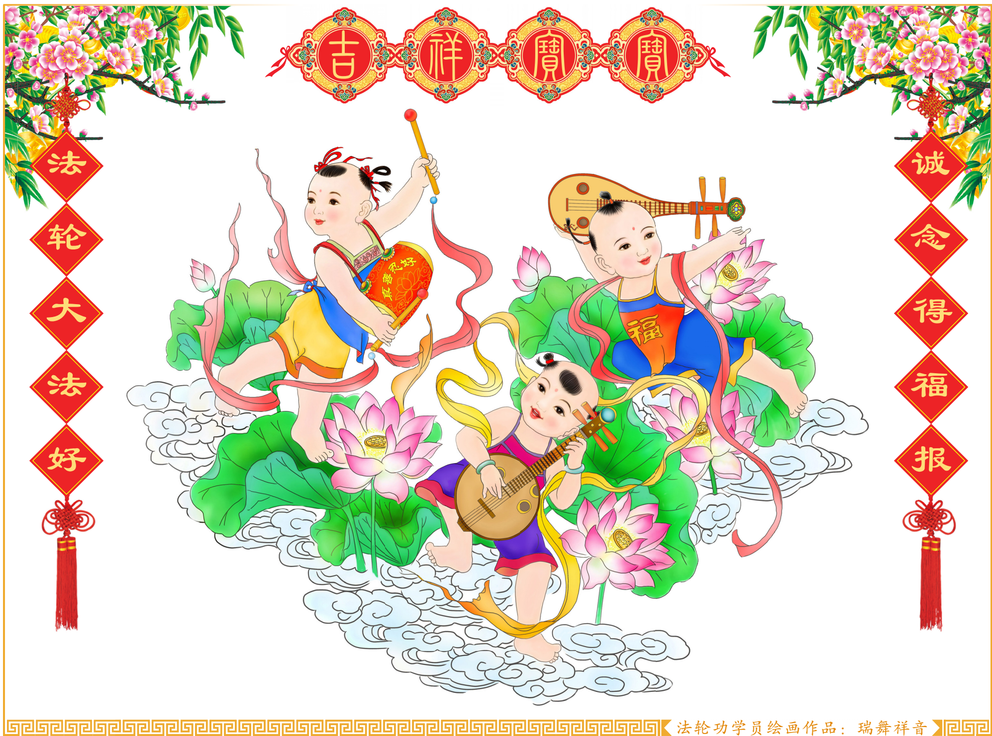
法轮功学员绘画作品：瑞舞祥音