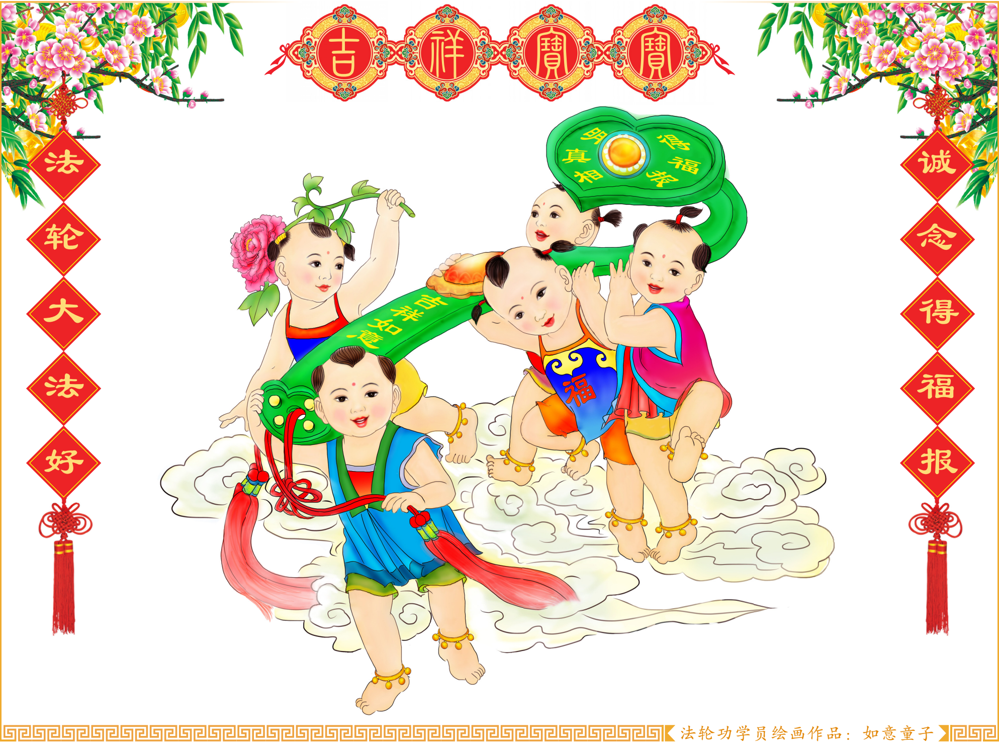
法轮功学员绘画作品：如意童子

我是湖北省咸宁市的一名西医大夫。一天，一个五岁的小男孩，被汽车撞了，来到医院急诊。他满头是血，脸变形了，鼻子塌了，左眼肿得厉害，用双手撑才只能看到一条缝；右侧大腿变形缩短；孩子处于昏迷状态。检查结果：颅底骨折，右侧股骨头骨折并髋关节脱位。医院立刻下了“病危通知书”。 可是，我发现孩子的母亲却有点奇怪，几次查房，她都在大声地对着孩子的耳朵不停地念“法轮大法好、真善忍好”。我当时有些不解，心想：孩子伤得这么厉害，念这几个字有什么用啊？我几次想劝她停下来，但又不忍心让她放弃最后的努力。身为医生，我很清楚，靠医治已是无力回天了。 第二天早晨查房，我简直不敢相信自己的眼睛，我看到孩子双眼睁开了，脸部肿胀完全消失，鼻子恢复了原样；再看他的右腿，也恢复了原样。再次拍片检查，发现孩子的右腿已无骨折和关节脱位，这简直不可思议！ 由此，我主动了解法轮功，找《转法轮》看，真正明白了法轮功真相。现在我从心里认定了“法轮大法好、真善忍好”，还主动退出了中共党团组织。