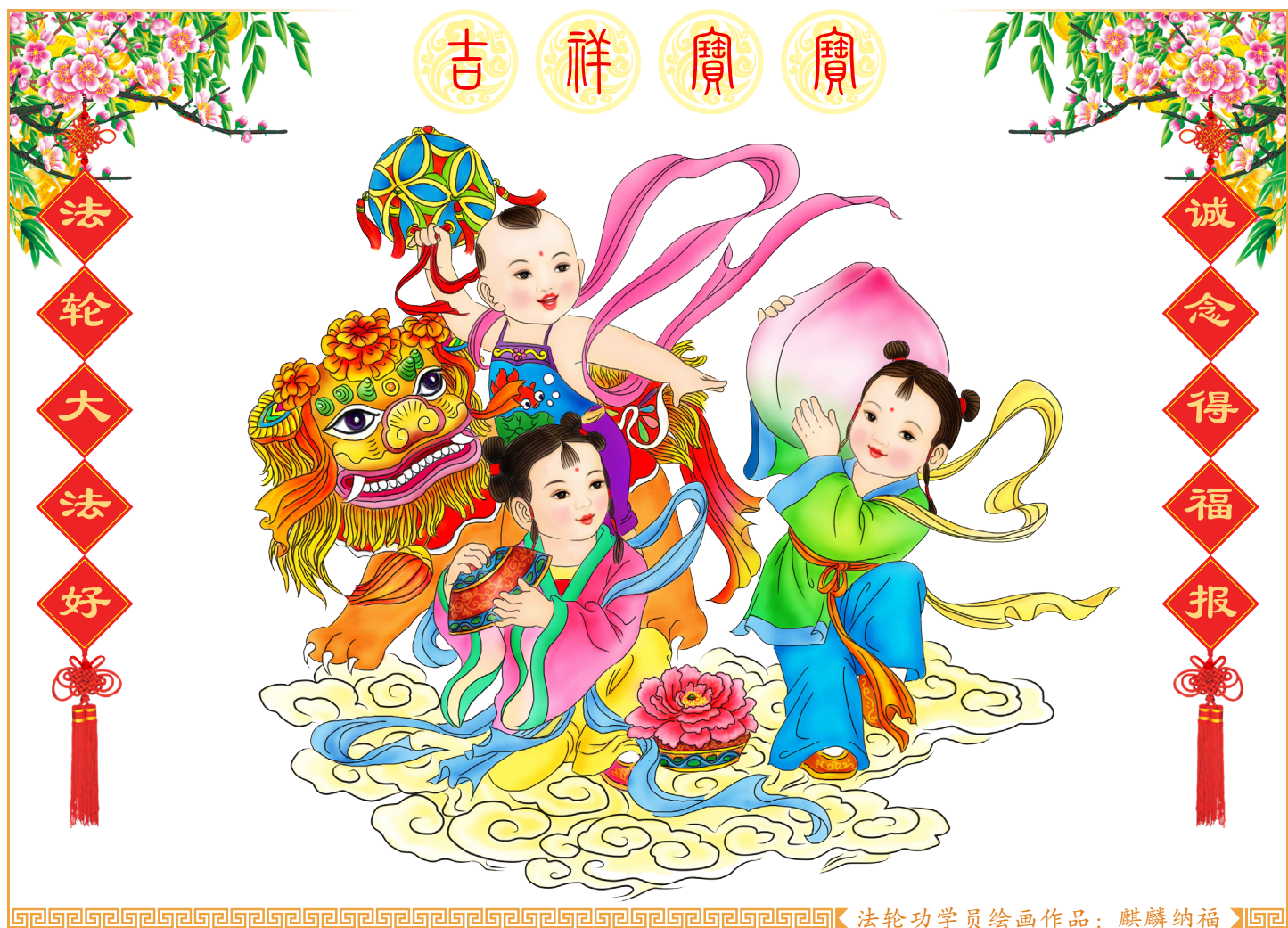
法轮功学员绘画作品：麒麟纳福