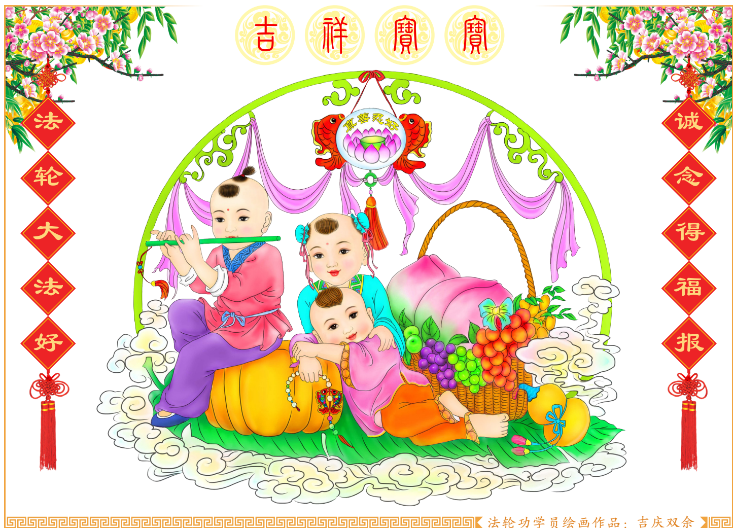
法轮功学员绘画作品：吉庆双余