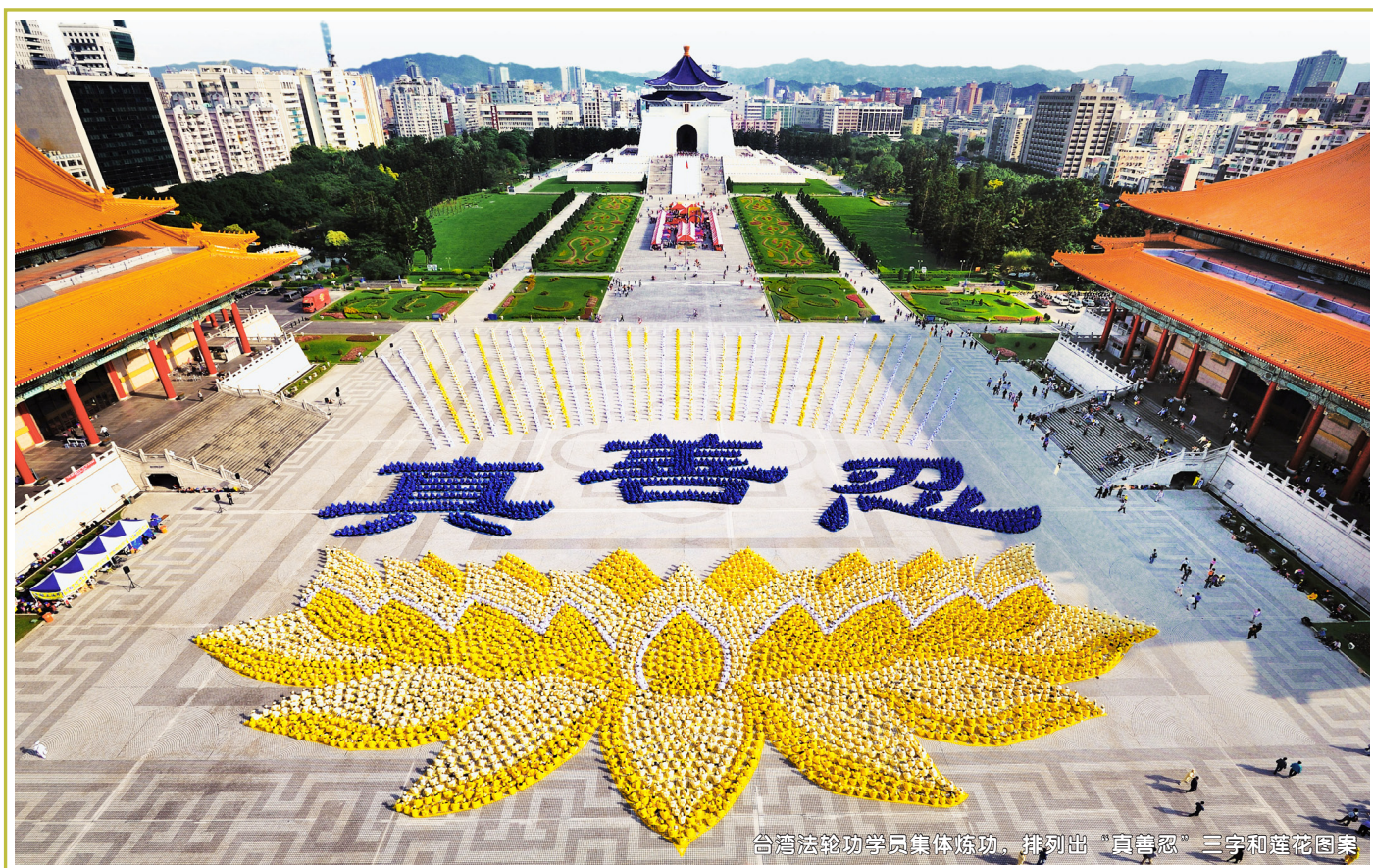
台湾法轮功学员集体炼功。排列出“真善忍”三字和莲花图案