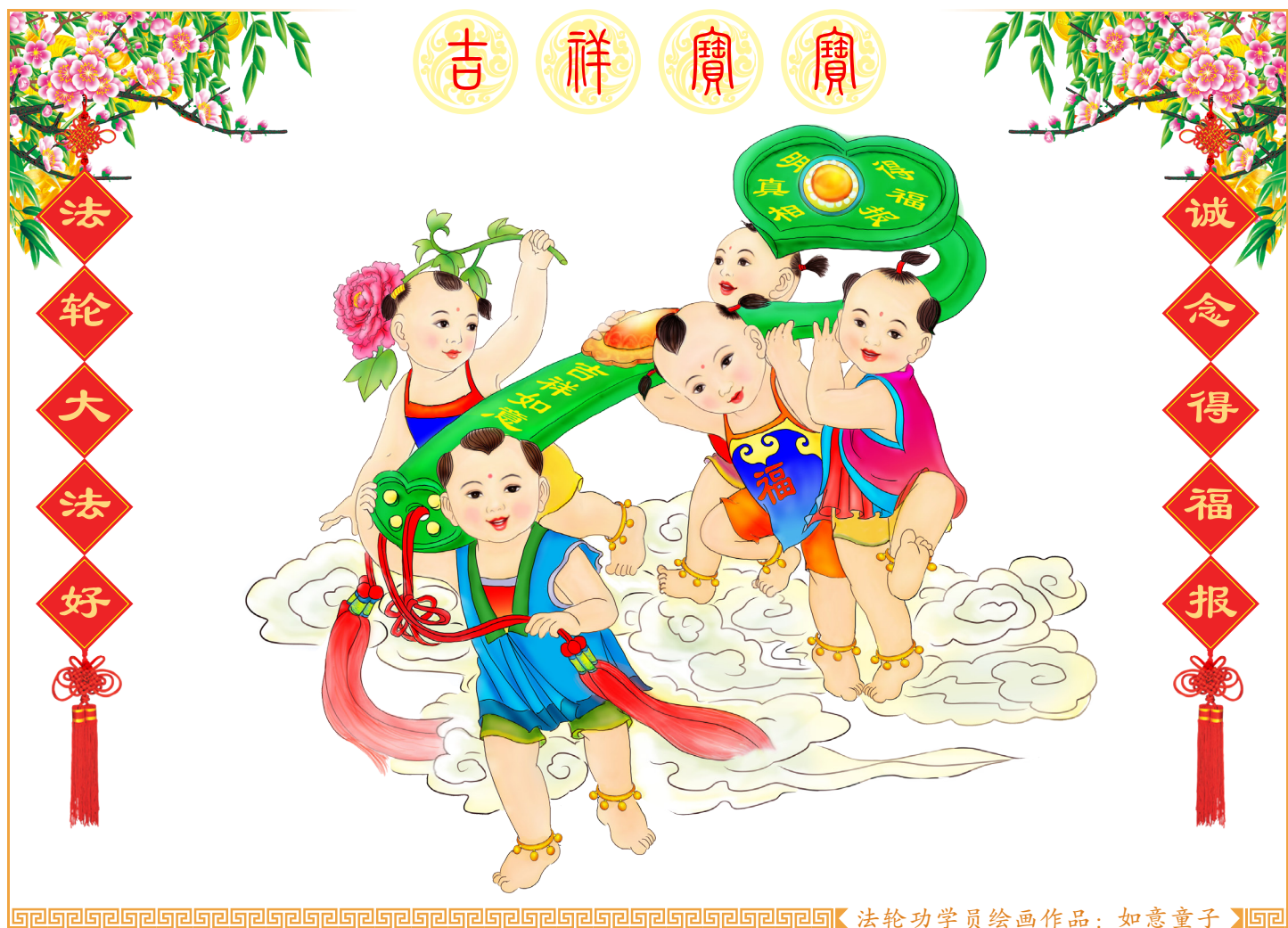
法轮功学员绘画作品：如意童子