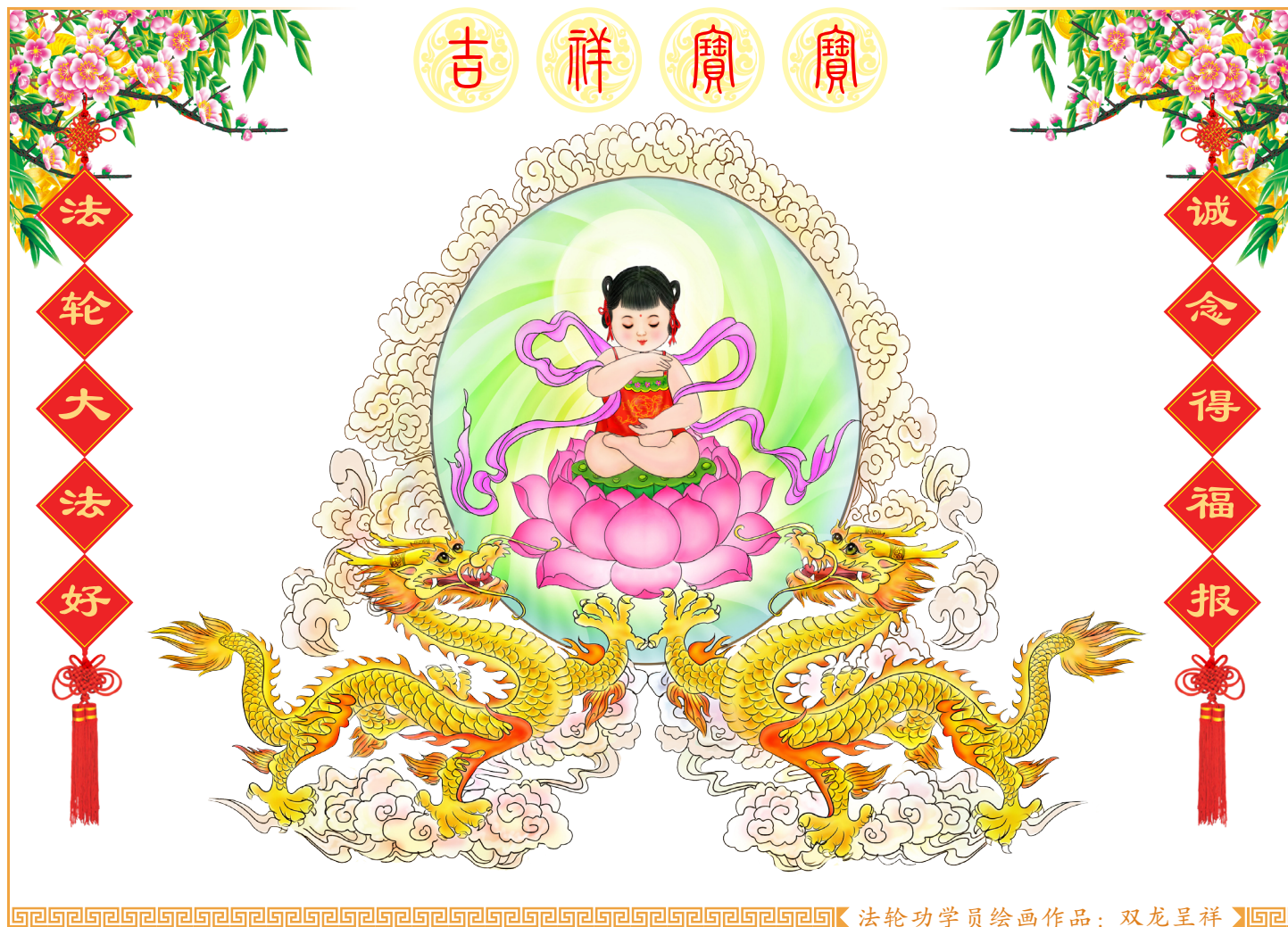
法轮功学员绘画作品：双龙呈祥