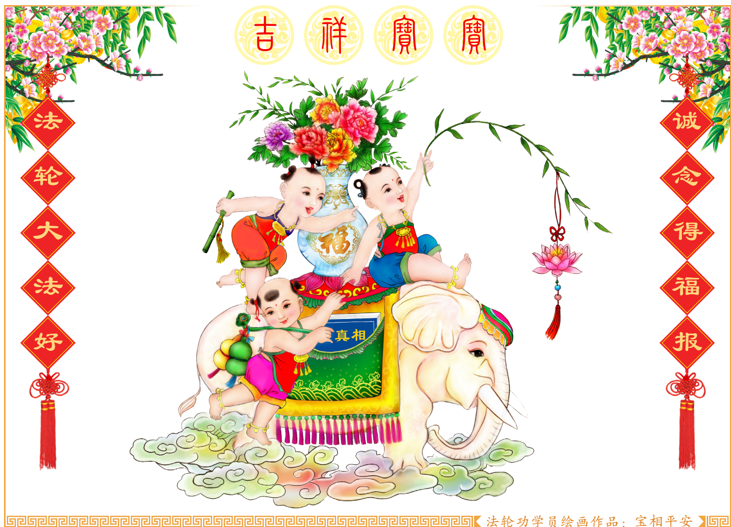
法轮功学员绘画作品：宝相平安