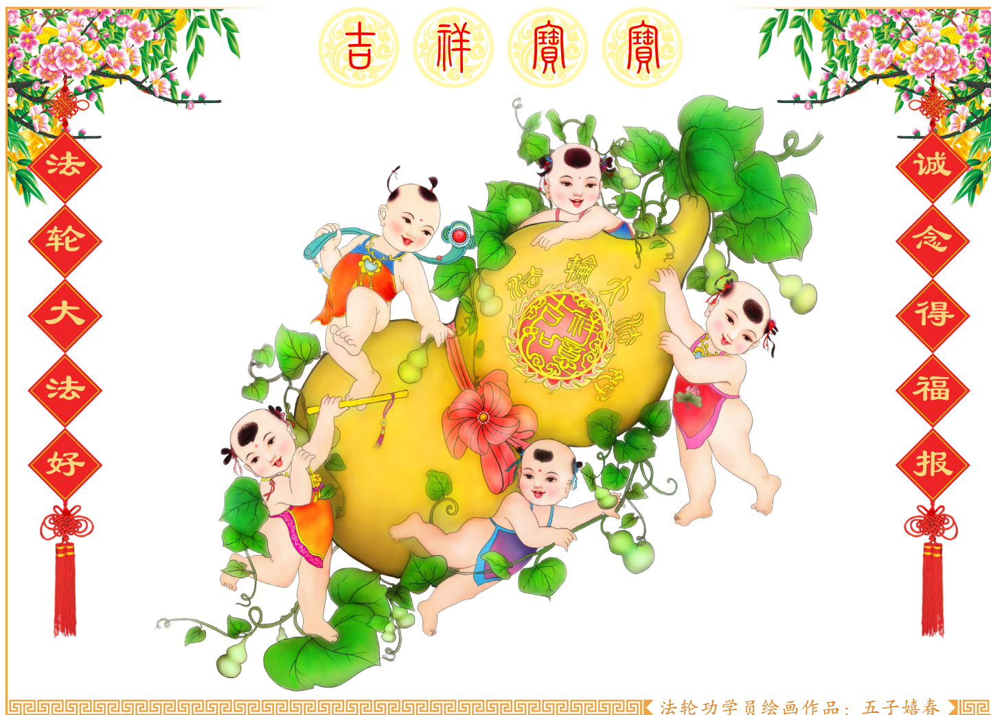
法轮功学员绘画作品：五子嬉春