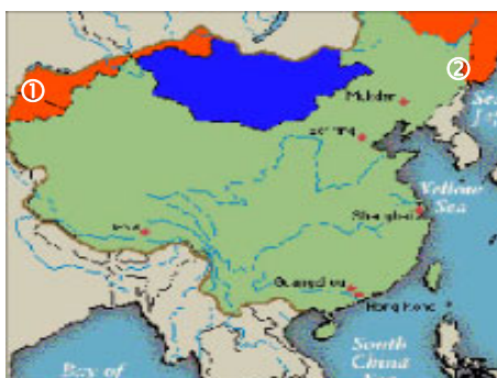
①②橙色部份为江泽民出卖的国土范围

几年来据中共中组部调查，中共高干家属、子弟移民海外，包括港澳在内的，共有108万人。据美国政府统计，中国部级以上的官员（包含已退位）的儿子辈74.5%拥有美国绿卡或公民身份；孙子辈有美国公民身份的达到91%以上。中共高官把自己的子孙和财产都挪到国外去了。