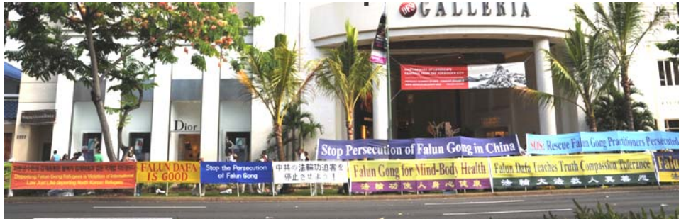
图：法轮功学员在夏威夷热闹的街区、峰会场外及中共官员入住的酒店外，拉起数十米长的横幅长墙，揭露中共对法轮功的人权迫害。

（明慧记者景如玉综合报道）二零一一年十一月十二日至十三日，亚太经济合作组织（简称 APEC）峰会在美国夏威夷檀香山举行，为了让前来参加峰会的各国首脑及代表团成员了解法轮功真相，来自台湾、日本、韩国、美国加州和瑞士的法轮功学员自十一月九日起，在夏威夷热闹的街区、峰会场外及中共官员入住的酒店外，拉起数十米长的横幅长墙，告诉人们：“法轮大法好，法轮功教人真、善、忍”，并揭露中共对法轮功学员持续了十二年的迫害，呼吁制止迫害。他们呼吁世人帮助营救在中国被非法关押的法轮功学员，制止中共虐