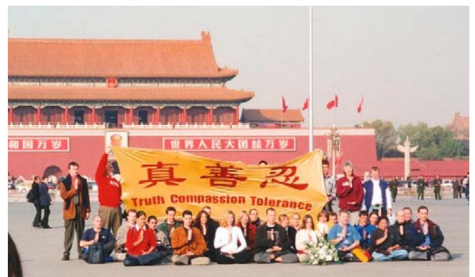
图：2001 年 11 月 20 日，三十六位西方法轮功学员在天安门广场抗议中共对法轮功的迫害。

凯特在骗他们，警察说，中共告诉他们法轮功在各国都被取缔了。而当被问及在天安门举“真、善、忍”横幅违反了哪条法律时，警察竟说“真、善、忍”这三个字在中国就是违法的。这让西方学员们感到太不可思议以及吃惊中国人民受欺骗到如此程度。