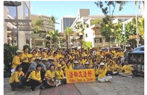
警察与法轮功学员合影, 高喊: “法轮大法好”

十三日, 法轮功学员等在中共官员住宿的酒店外。除了法轮功学员外, 另外也有几个拿着中共血旗的海外留学生。许多法轮功学员便开始对他们讲述法轮功在中国遭受迫害的真相, 希望他们明白中共假恶斗的本