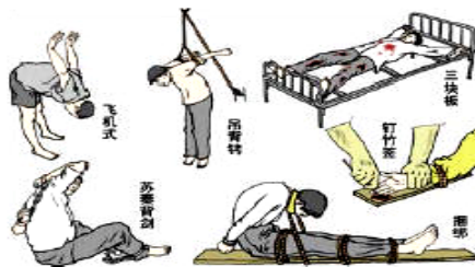
中共在迫害法轮功群众上不择手段，使用酷刑至少达 40 种以上，使用对象中妇女和老人占相当比例，令人发指。

在此正告这三个部门：现在的中共邪党已经是摇摇欲坠，赶快停止对法轮大法和法轮功学员的迫害，你们今天所作的恶，我们一直会追查到底，追究到底的，希望你们不要成为中共邪党的陪葬品。