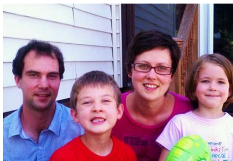
图：拥有幸福家庭的凯（右二）经常以自己的亲身经历讲述法轮功真相

凯以前患严重的背痛和颈痛，不得不辞去工作，四处就医。尝试了各种医疗方法，付出了昂贵的医疗费，仍不见效。走投无路之际，一九九八年八月，她遇到了法轮功，生命从此开始了阳光普照。在二零一一年五月十三日“世界法轮大法日”的纽约庆