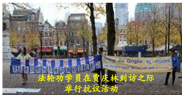
法轮功学员在贾庆林到访之际举行抗议活动

贾庆林在一九九九年至二零零二年担任中共北京市委书记期间，直接参与和负责对众多法轮功学员施以非法关押及酷刑迫害等罪行，这段时间是北京对法轮功学员迫害最疯狂的时期。许多学员被迫害致死，“天安门自焚栽赃案”也是在此期间上演的。