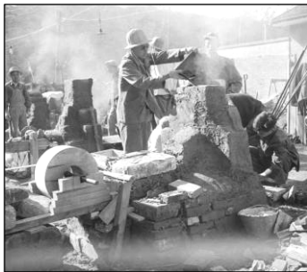
图：中共发动“大跃进”运动，造成四千万人死亡的大饥荒。

二十多年前，曾任国务院经济体制改革研究所所长的陈一咨根据赵紫阳的指示，做过一次调查统计，结果是“大跃进”