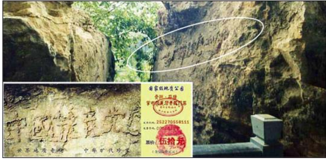
윗 그림은 “장자석” 사진이고 작은 그림은 풍경구 문표이다

국공산당망”이란 큰 6 석 글자가 나타났는데 그 중 그 “망”자는 특별히 컸다. 중국의 여러면의 지질전문가들이 실지에서 고찰한 후 돌에 있는 글자는 천연으로 형성된 것이며 인공으로 조각하고 부각한 흔적이 없다고 일제히 검정하였다. 중앙텔레비전의 《과학 가까이에 다가가다》절목, 중앙텔레비전 7 프로, 10 프로 절목에서 여러차례 재방송을 하였다. 이 모든 것은 기실 모두 사람들에게 “하늘이 중공을 멸한다”는 천상을 알려주고 있으며 사람들이 “탈당하여 평안을 보장”하기를 희망하는 것이다.。