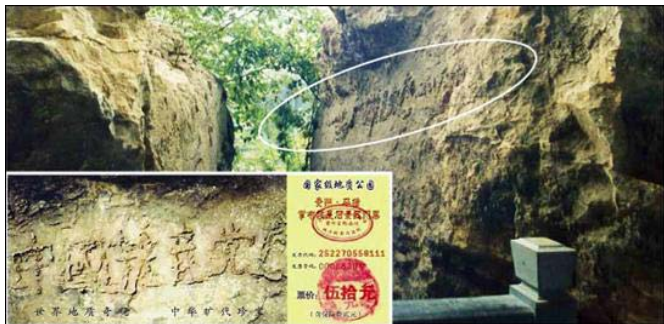
윗 그림은 “장자석” 사진이고 작은 그림은 풍경구 문표이다

국공산당망”이란 큰 6 석 글자가 나타났는데 그 중 그 “망”자는 특별히 컸다. 중국의 여러면의 지질전문가들이 실지에서 고찰한 후 돌에 있는 글자는 천연으로 형성된 것이며 인공으로 조각하고 부각한 흔적이 없다고 일제히 검정하였다. 중앙텔레비전의 《과학 가까이에 다가가다》절목, 중앙텔레비전 7 프로, 10 프로 절목에서 여러차례 재방송을 하였다. 이 모든 것은 기실 모두 사람들에게 “하늘이 중공을 멸한다”는 천상을 알려주고 있으며 사람들이 “탈당하여 평안을 보장”하기를 희망하는 것이다.。