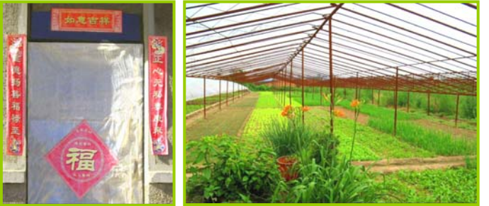
그림 : 《신기한 발》 중 너주인의 발과 발에 있는 단층 집이다. 문에 있는 주련(对联)은 여전히 선명하다: 덕을 중히하고 선을 선양하면 복록이 오고 바른 마음에 사심이 없으면 건강과 태평이 온다. 복(福)자 웃쪽에는 “쩍싼런은 좋다”가 씌여져 있다