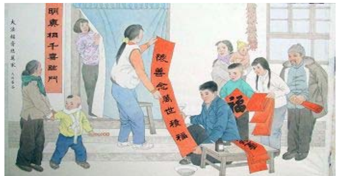
그림: 진상을 명백히 아니 천가지 기쁨이 들어오네

한 나머지 뛰면서 손을 저어 높은 소리로 외쳤다 : “파룬따파는 좋다! 쯔, 썬, 런은 좋다! 리대사님 빨리 우리를 도와 불을 꺼주세요!” 나의 외침소리가 몇자마자 그 불은 눈이 생긴 듯이 나의 집 장막에서 멀지 않는 곳에서 바람을 맞아서 감아 돌아갔다. 큰 불은 이길로 붙어 왔기때문에 다시 감아 돌아가도 더는 탈 것이 없었다. 이렇게 큰 불은 점점 작아지고 얼마 지나지 않아 꺼져버렸다.