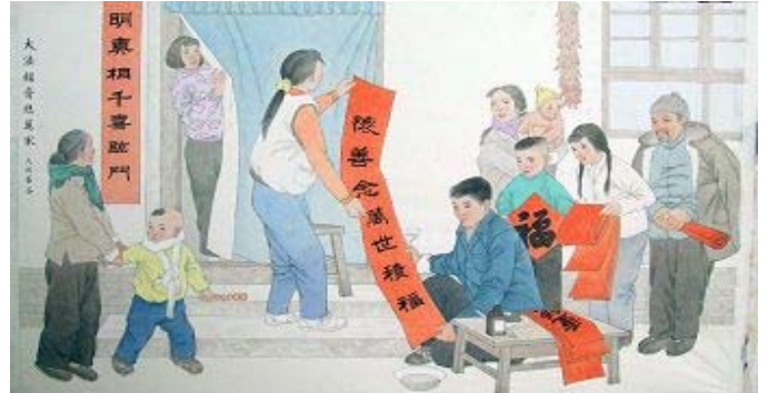
그림: 진상을 명백히 아니 천가지 기쁨이 들어오네

한 나머지 뛰면서 손을 저어 높은 소리로 외쳤다 : “파룬따파는 좋다! 쯔, 썬, 런은 좋다! 리대사님 빨리 우리를 도와 불을 꺼주세요!” 나의 외침소리가 몇자마자 그 불은 눈이 생긴 듯이 나의 집 장막에서 멀지 않는 곳에서 바람을 맞아서 감아 돌아갔다. 큰 불은 이길로 붙어 왔기때문에 다시 감아 돌아가도 더는 탈 것이 없었다. 이렇게 큰 불은 점점 작아지고 얼마 지나지 않아 꺼져버렸다.