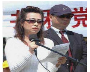
그림: 2006년 백공 부근에서 증인 안니와 피드가 친히중공이 파룬궁 학원의 생체기관을 적출한 하늘에 사무치는 죄행을 폭로하였다.

2006년 3월 17일 두번째 증인 안니(安妮 가명)가 나섰다. 《대기원》은 “주치수술 의사의 마누라가 소가툼에서 기관을 적출한 내막을 적발하다”라는 제목으로 문장을 발표하였는데 증인 안니는 폭로하기를 그녀의 전 남편은 친히 매우 많은 파룬궁 학원의 안각막(眼角膜)을 뜯어내었다고 하였다. 2003년이래 그의 전 남편은 정신이 흐리멍텅하기 시작하고 저녁에 식은 땀을 흘리고 악몽을 꾸고 침대보는 사람형태로 젖어 있었다. 후에야 비로서 그는 가족에게 알려주었는데 병원에서는 대량적으로 파룬궁 학원의 신장(腎