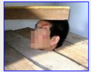
酷刑演示：吉林监狱残害学员的酷刑——“上枷锁”并被毒打