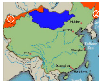
图：①②橙色部份为中共江泽民集团出卖的国土范围