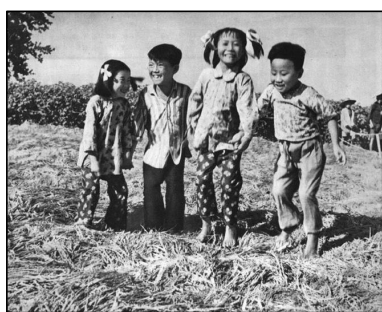
图：中共媒体为渲染“亩产万斤”，连篇刊登文章及小孩站在浓密禾苗上的照片。