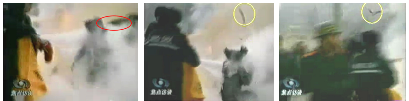
图：CCTV“自焚”镜头：1：灭火器喷射的同时，一只手臂抡起，猛击刘春玲头部 2：重物猛击刘的头部后被弹起 3：重物逆着灭火器喷射流飞向警察 4：一名身穿大衣的男子站在出手打击的方位，仍保持着一秒钟前用力打击的姿势。

把“自焚”镜头慢速播放，可以看到：所谓自焚者刘春玲没有被火烧死，却被警察用重物击打头部倒下。《华盛顿邮报》记者曾专程到刘春玲的家乡调查，邻居说从来没见过她练习法轮功，她殴打养母，并以三陪为生。刘春玲不是法轮功修炼者。