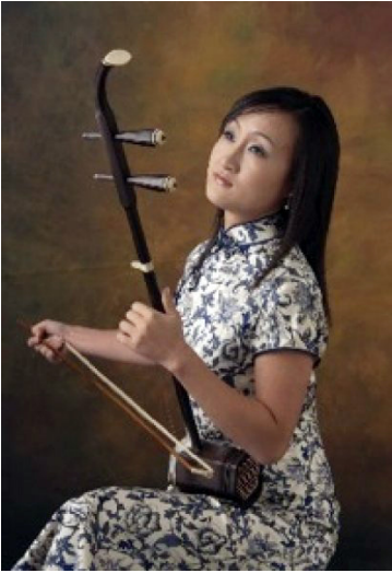
图：二胡演奏家戚晓春