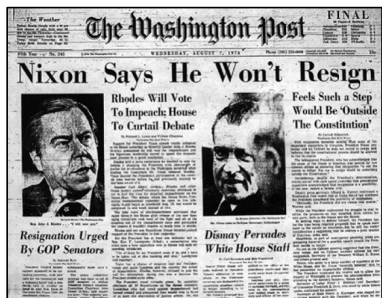
图:1974年8月7日尼克松总统辞职前两天，华盛顿邮报持续报道水门事件。

从央视的电视画面上可以看到，所谓的“自焚者”王进东点火自焚后，两腿间盛着汽油的塑料雪碧瓶却完好无损。身后的警察拎着灭火毯静静等待，直到王进东对着摄像机镜头喊完口号，才把灭火毯盖在他头上。到底是