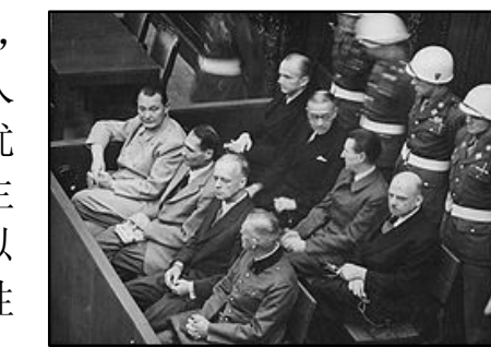
图：纽伦堡审判历史图片。1945年二战结束后，纽伦堡国际军事法庭永远否决了纳粹帮凶“奉命行事”的辩解。

今天，如果你去德国，没有人说我们要对希特勒和纳粹“一分为二”，而且，现在拥有纳粹的标志，或者对希特勒崇拜都是违法的。