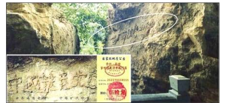
上图为“藏字石”照片，小图为风景区门票。

俗话说，“人不治天治！”古人讲究“天人合一”，“三退”就是天灭中共的天象在人间的表现。