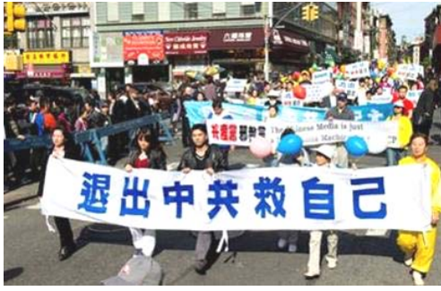
图左：庆祝一亿四百万中国人“三退”大游行

十月十六日，纽约法轮功学员和当地民众在纽约中国城的哥伦布公园举行盛大集会，声援一亿四百万中国人退出中国共产党、共青团和少先队（三退）的义举。集会后，大纽约地区的法轮功学员以及各界支持人士又举行了反迫害游行，呼吁“解体中共，结束迫害”。