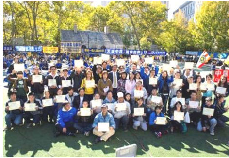
图右：集会现场 41 位来自中国大陆人士现场退出中共组织。

经开始用在其他中国人身上。因此，更多的中国人退出中共及其相关组织就变得如此的重要。