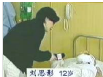
重度烧伤病人最大的危险是细菌感染。画面上的记者既不穿隔离衣，也不戴口罩帽子，就近距离采访问话。