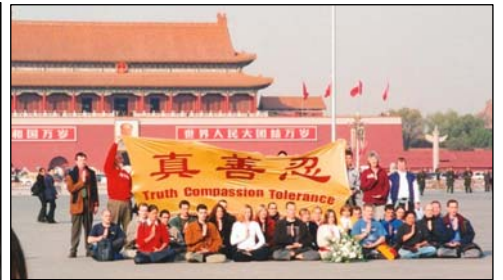
图：2001 年 11 月，12 个国家的 36 名西人法轮功学员到天安门告诉中国民众真相。