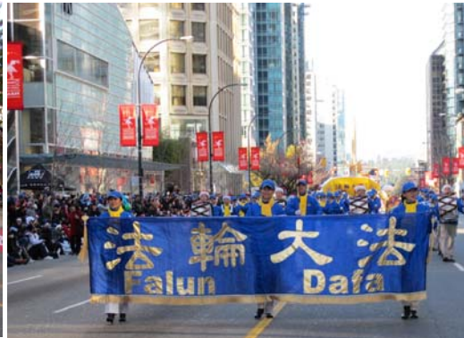
游行中的天国乐团

(明慧记者王枚温哥华报道)二零一一年十二月四日，加拿大温哥华第八届圣诞大游行下午于市中心举行，吸引超过三十万民众观看。法轮功学员的游行队伍是当天阵容最大、最亮丽的一个方阵，沿途受到观众的热烈欢迎。