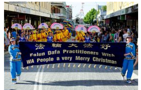
弗雷曼特尔市的法轮功游行队伍

在港口城市弗雷曼特尔的游行，法轮功学员主要表演腰鼓和舞龙。弗雷曼特尔是西澳最古老而且最具活力的城市之一，最著名的传统的节日叫弗雷曼特尔节(Fremantle Festival)，是全澳洲最长的节日，历时两个多星期，圣诞游行是这个节日的压轴大戏，当地民众每年都是万