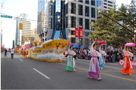
法轮功学员的仙女队和大花车