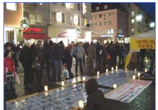
弗莱堡市中心, 人们驻足了解法轮功真相

留学生指着遗像问: “这是真的吗?” 学员说, 每张照片上都有姓名、遭迫害经历等尽可能详细的信息, 是真人真事, 你可以根据上面的信息自己去了解。可以肯定地告诉你, 他们都是因为不放弃修炼“真、善、忍”, 学做好人而被中共迫害致死的。留学生点头说, 中国国内(污蔑法轮功的宣传)都是造谣瞎说吧? 学员说, 中共对法轮功完全是栽赃陷害, 目的为煽动民众仇视法轮功。◇