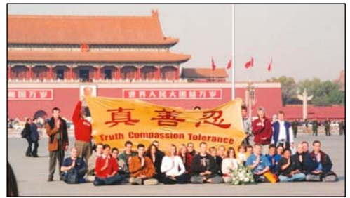
图:2001年11月,12个国家的36名西人法轮功学员到天安门告诉中国民众真相。