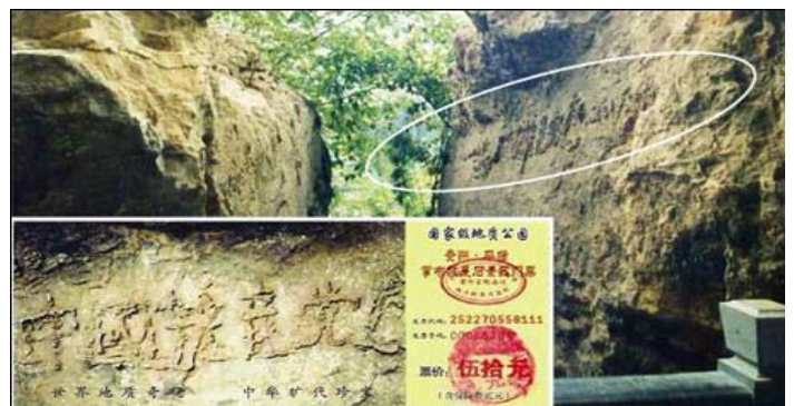
图为“藏字石”照片, 小图为“藏字石”风景区门票。

希望善良、理性的辽阳父老乡亲, 一定要分清善恶正邪, 认清中共的所谓“承诺卡”签名活动的害人技俩, 做出正确的选择。愿您拥有美好的未来! ◇