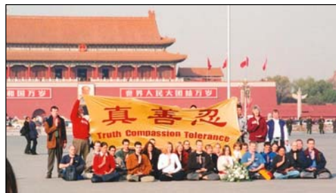
图:2001年11月,12个国家的36名西人法轮功学员到天安门告诉中国民众真相。