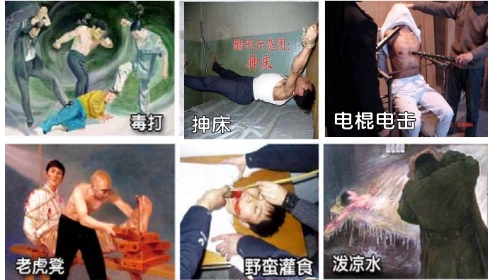
法轮功学员遭受的部分酷刑

法轮功学员通常是凌晨四点左右被带进“东港”上刑，晚上九、十点钟被带回，有的长期押在“东港”每