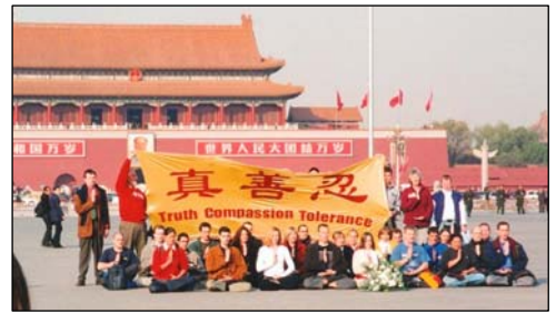
图:2001年11月,12个国家的36名西人法轮功学员到天安门告诉中国民众真相。