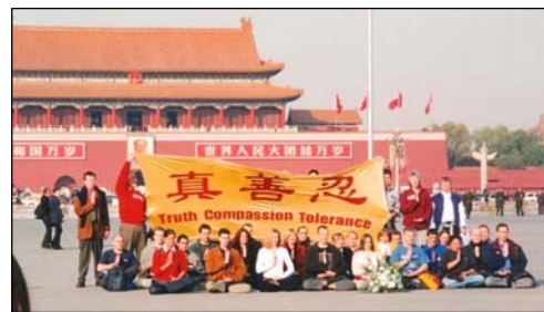
图：2001年11月，12个国家的36名西人法轮功学员到天安门告诉中国民众真相。