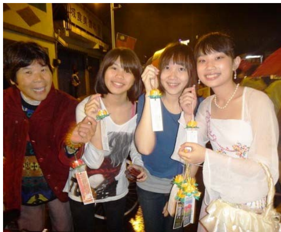
民众喜拿莲花结善缘

法轮功一九九二年自中国传出，至今已洪传世界一百多个国家及地区，使上亿人身心受益。东华大学法轮功社团参加此次游行活动，希望把“真、善、忍”的美好带给当地社区民众。虽然天空飘着蒙蒙细雨，法轮功学员沿途展示功法，表演中国传统文化的唐鼓，还有女学员穿着仙女服分送莲花与民众结善缘，成为游行队伍中众人瞩目的焦点。◇