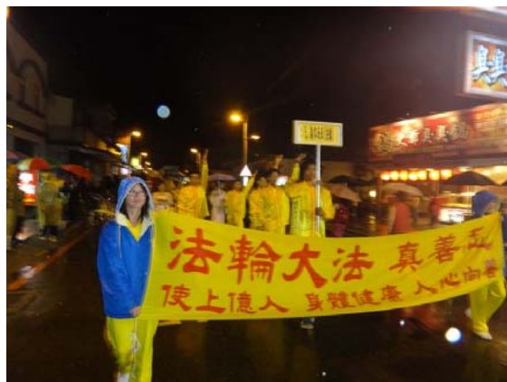
东华大学法轮功学员参加游行，与民众分享“真、善、忍”的美好