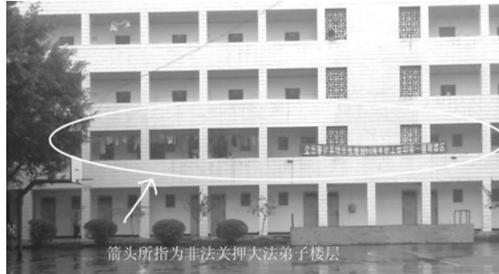
■内江技工学校（洗脑班）大门 ■校内宿舍，所圈楼为关押大法学员楼层

（明慧网通讯员内江报道）内江谢家坝技工学校里长期办着一个对外称“崇尚科学技术学校”或“法制学习班”，而实则是内江“六一零”（注）非法办的迫害善良的法轮功修炼者的洗脑班。