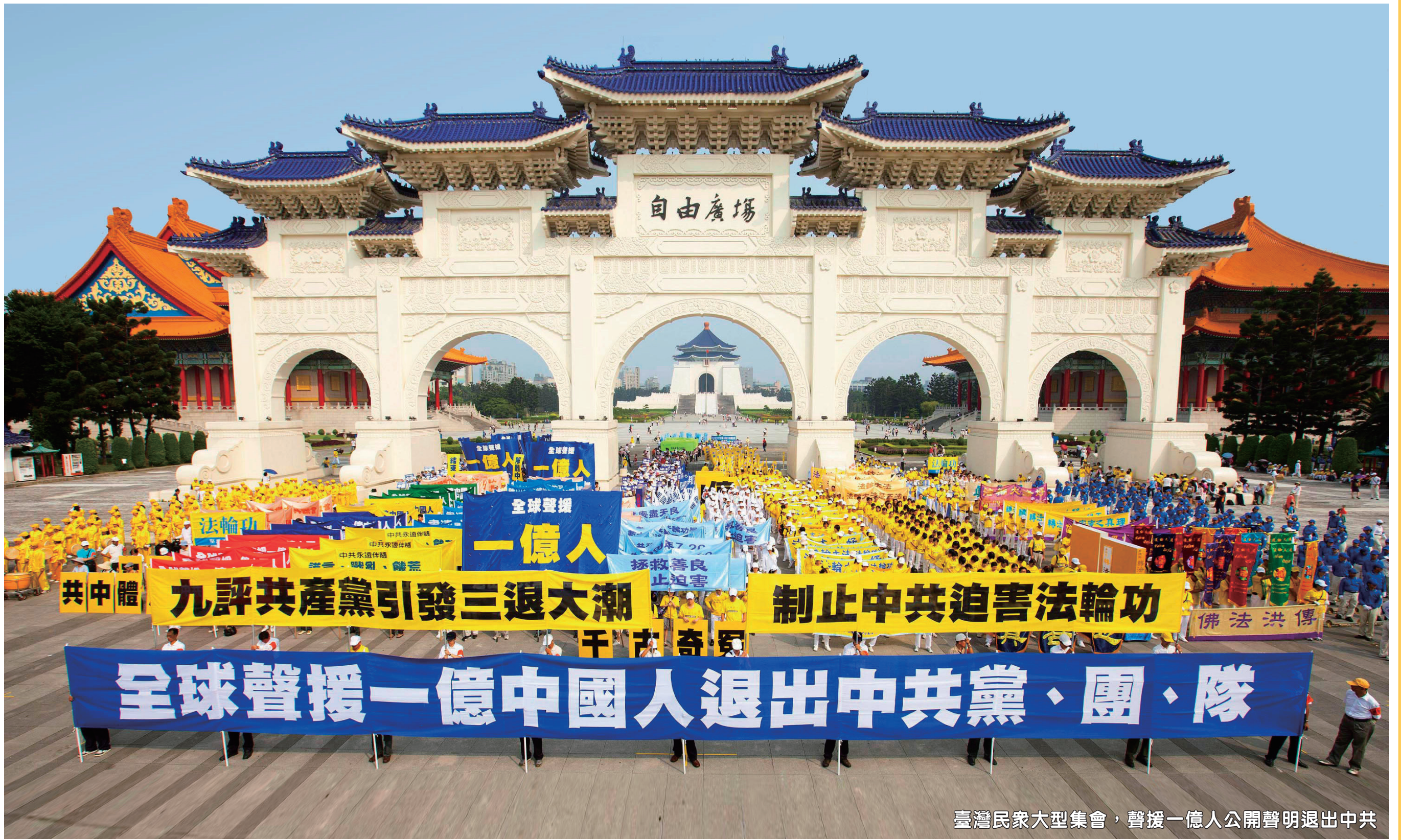
臺灣民衆大型集會，聲援一億人公開聲明退出中共