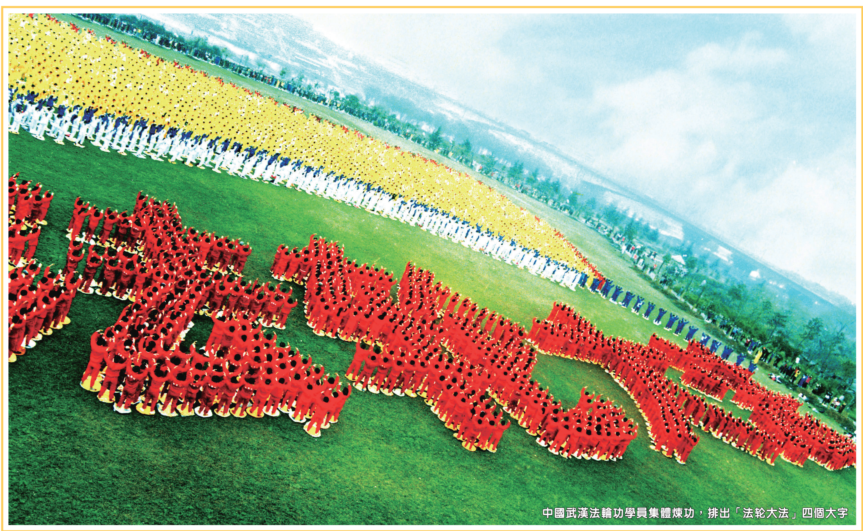
中國武漢法輪功學員集體煉功，排出「法轮大法」四個大字