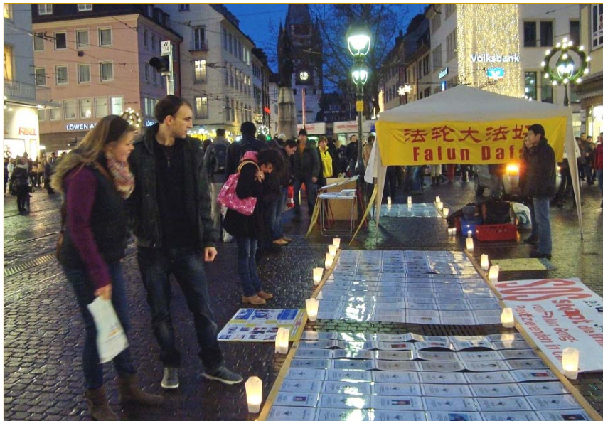
德国弗莱堡市中心，人们纷纷驻足了解法轮功真相

【明慧网】二零一一年十二月十日，德国弗莱堡市中心的一场烛光守夜活动，吸引了摩肩接踵的人群，这是德国法轮功学员们谴责中共迫害法轮功，纪念世界人权宣言颁布六十三周年的活动。