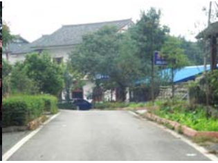
高新区洗脑班设在桃林人家内