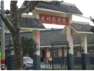
安县晓坝洗脑班设在敬老院内