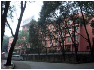
朝阳厂洗脑班设在叠翠山庄内

【明慧网二零一一年十二月十五日】（明慧网通讯员四川报道）二零一一年，绵阳市政法委、“六一零”（中共为迫害法轮功