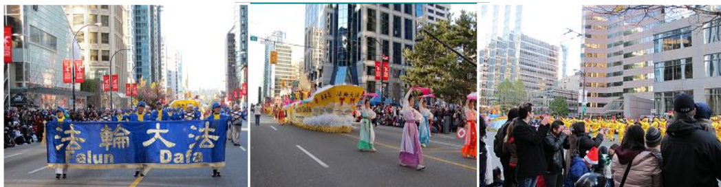
■ 游行中的天国乐 ■ 法轮功学员的仙女队和大花车 ■ 观看法轮功游行的民众

天国乐团经过的时候，喧闹的观众一下静下来了，仿佛被震住了，都在静静地聆听乐曲；美丽的仙女又使观众眼睛一亮；随后的花车，“哇”，人群欢呼了，这么大的花车，这么漂亮，这么殊胜；后面的主要由老年学员组成的腰鼓队，铿锵、欢乐的鼓声带来了东方文明古国特有的风韵和节日气氛。