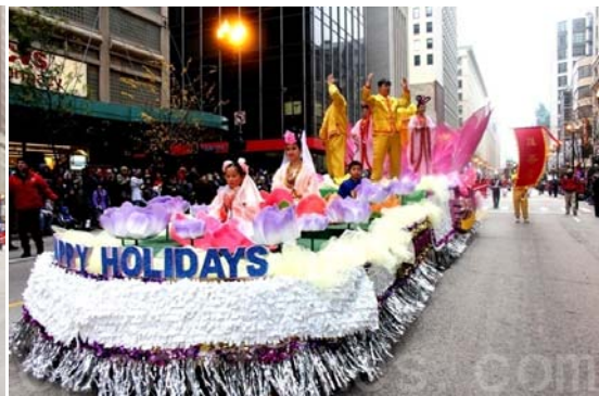
芝加哥法轮功学员参加二零一一年感恩节大游行

哥论坛报》在其网站上发表了法轮功团队的花车的照片。数以百万计的电视观众也通过电视直播看到了法轮功学员的风采。