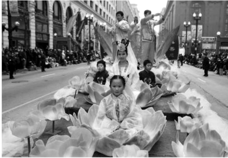
The Falun Gong float (Michael Tercha, Chicago Tribune / November 24, 2011)

【明 慧 网】 2011 年 11 月 24 日，美国芝加哥“麦当劳”感恩节大游行在政府大道上举行，数十万观众夹道观看。法轮功学员也参加该游行，他们带来的新创意——巨型莲花，受到观众的喜爱。芝加哥当地最大的报纸《芝加哥论坛报》做了相关报道，在其网站上发表了法轮功团队的花车照片。数以百万计的电视观众通过直播看到了法轮功学员的风采。2003 年，法轮功首次参加芝加哥感恩节游行，其新颖独特的设计获得组委会的喜爱，之后他们年年受邀，今年已经是第九年。◇