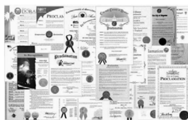
李洪志先生和法轮大法获得各国政府各类褒奖、支持决议案和信函超过 3000 项（上图为部分褒奖）。

按常理，一个真想自焚的人，应当找一个没有人来往的地方去利利索索地自焚，可他们偏找一个人满为患的地方去自焚，这不成心跟自己捣乱吗？他们到底是真自焚还是在演戏？一般来说，到天安门自焚的人一定有了天大的冤屈，才来这里制造很大的影响，可为什么媒体却偏偏没有报道这方面的背景？看到北美人在自由自在地炼功，这些很长时间一直困扰我们的问题，一下子全都涌现出来。当时我们就想：“天安门自焚”事件实在是一道很低级的智力测验题，只要稍微动点脑子，就能产生很多疑问。