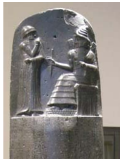
图: 人类第一部法典“汉谟拉比法典”, 上部浮雕为汉谟拉比从太阳神手中接过权杖, 启示人们法律是神赋予人类的, 用以维护人间的公平与正义。