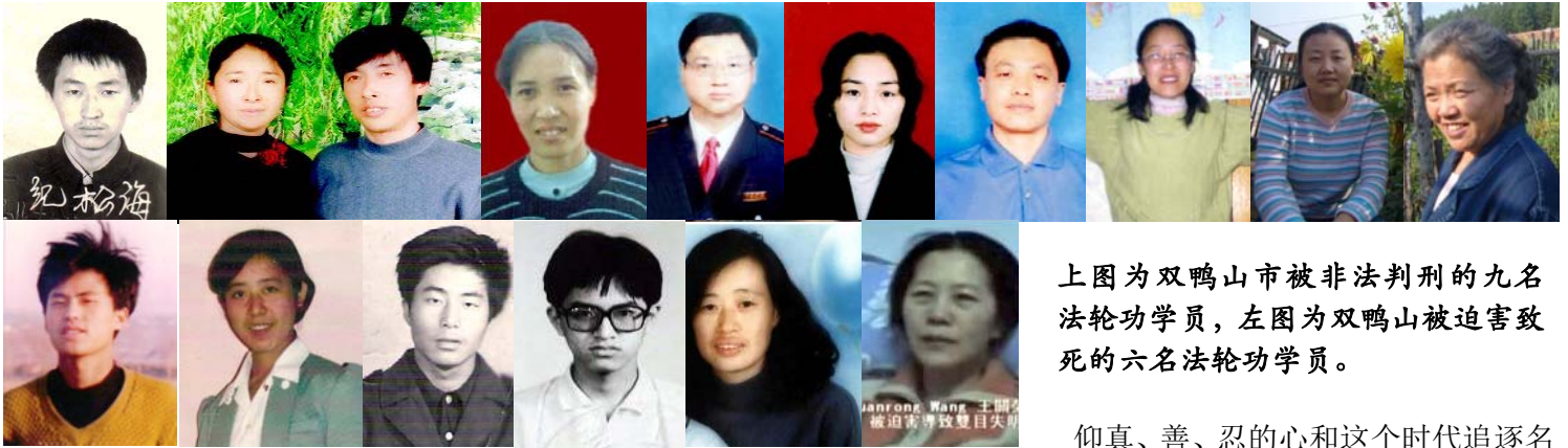
上图为双鸭山市被非法判刑的九名法轮功学员，左图为双鸭山被迫害致死的六名法轮功学员。

2012 年即将来临，在这岁末年初的日子里，在您和您的家人团聚的时候，你可曾想过有这样一群人，他们不为名，不为利，只为维护真、善、忍的信仰正在承受着苦难，铁窗隔开了他们家属对他们的思念，高墙内他们正在蒙受着不白之冤。